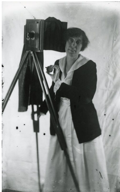
Slika 27. Matthews, Kate, Self-portrait with Camera , 1900.

paletu bilo lakše i diskretnije uklopiti u prikaz te se moglo jednostavnije s njom rukovati zbog njene veličine, fotografski aparat na stativu predstavljao je izazov za fotografe i fotografkinje koji su željeli autoportret vezati uz svoju profesiju. Takvo uklapanje fotografskog aparata u autoportretni prikaz predstavljalo je veći izazov za fotografkinje, koje su morale pronaći način kako vizualno prikazati svoj odnos prema umjetničkom alatu koji je najčešće bio i veći od njih samih. Zbog kontrasta između veličine kamere i visine fotografkinje, autoportreti fotografkinja s aparatom davali su prikazanim ženama veći dojam moći i kontrole. 75