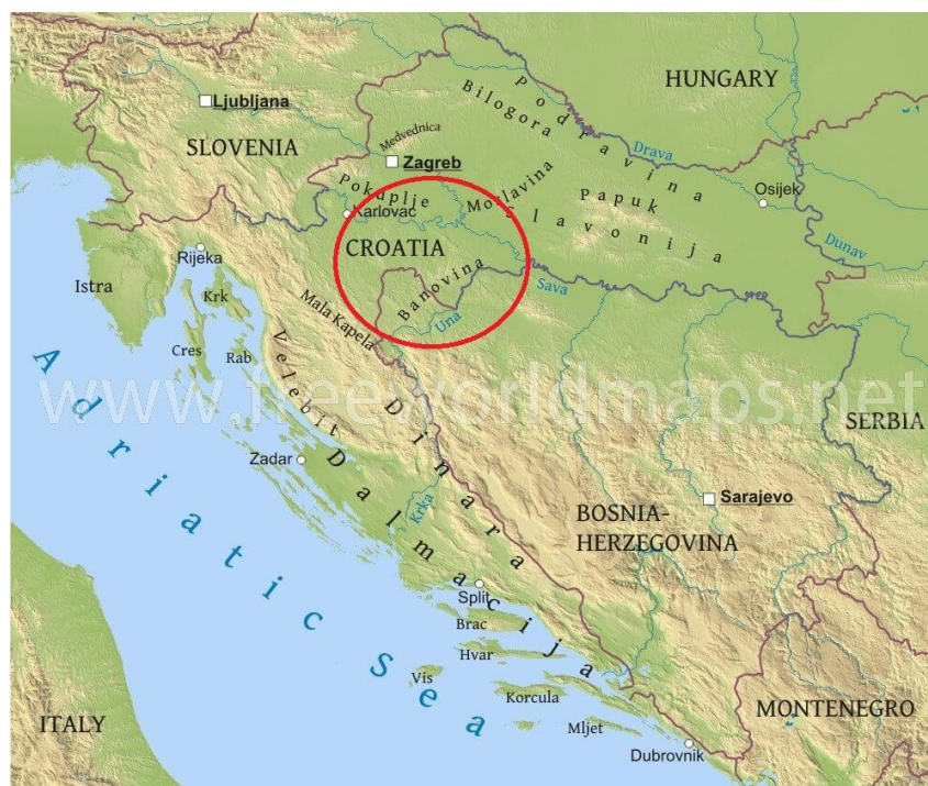
Slika 3.1.2. Područje uzgoja Banijske šare svinje