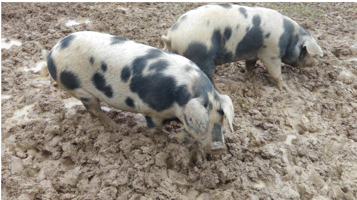
Slika 3.3.4.1. Banijska šara svinja na otvorenom

Otvoreni sustav držanja karakterističan je za ekstenzivnu proizvodnju. Sve kategorije svinja drže se na otvorenom i omogućeno im je slobodno kretanje. Grade se samo jednostavniji i jeftiniji objekti za hladniji dio godine ili za zaštitu od nepovoljnih vremenskih uvjeta (sunce, kiša, tuča). Smanjeni su troškovi smještaja i energije, a više pažnje posvećuje se očuvanju okoliša i dobrobiti svinja. Preduvjet koji je potrebno ispuniti za držanje svinja na otvorenom je posjedovanje velikih zemljišnih površina, jer naseljenost ne bi trebala prelaziti 25 krmača s prasadi po hektaru (Uremović i Uremović 1997.), odnosno 15 do 20 tovljenika po hektaru, ovisno o završnoj tjelesnoj masi tovljenika i količini dostupne hrane na otvorenom. Ukoliko se upotrebljavaju pašnjaci, iskorišteni dio treba održavati na način da se po potrebi uredi, pokosi, poravna, te pognoji (Pejaković 2002.).