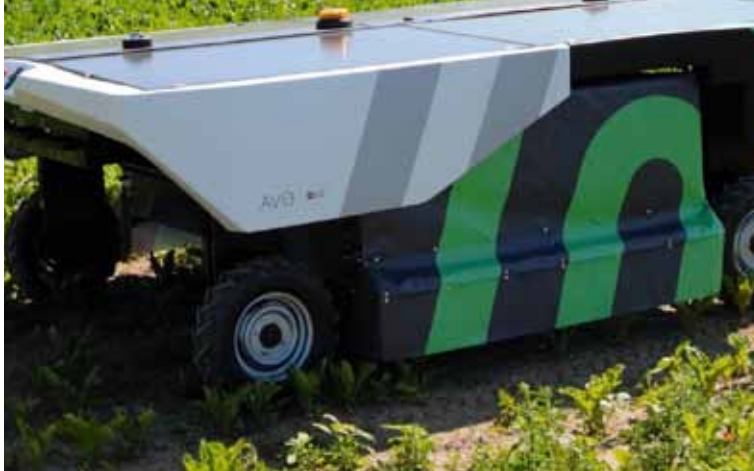
Slika 4. Robot za suzbijanje korova selektivnom kemijskom aplikacijom EcoRobotix Avo Figure 4. Robot for weed control by selective chemical application EcoRobotix Avo