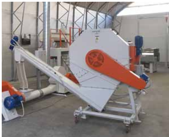
Slika 10. Rezačica biljne mase Figure 10. Herbs cutter

Namijenjena je za rezanje različitih vrsta bilja u svježem ili suhom stanju. Duljina reza bira se prema zahtjevu tehnologije. Može se koristiti i za usitnjavanje osušenih materijala prije mljevenja. Rezačica se sastoji od postolja, rotorskog i statorskog sklopa.