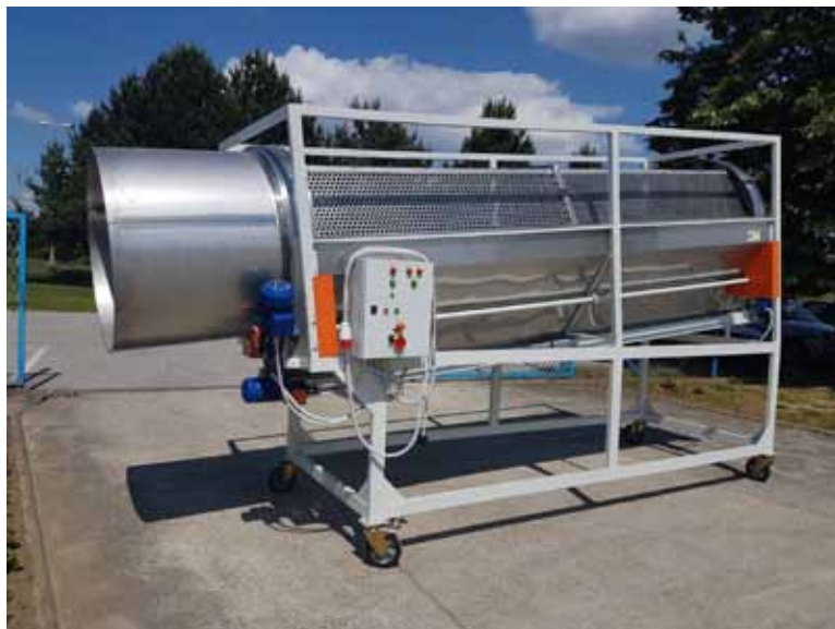
Slika 2. Cilindrični separator

Upotreba ciklindričnog separatora neizostavan je dio dorade kamilice jer se time smanjuje trošak sušenja, a povećava kvaliteta i ukupna vrijednost ubrane mase.