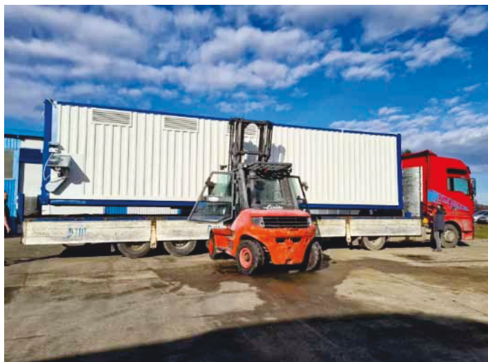
Slika 3. Univerzalna prijenosna kontejnerska sušara

Pod ove sušare čini perforirani pocinčani lim debljine 1,2 mm i promjera perforacija za ventilaciju od 3,2 mm.