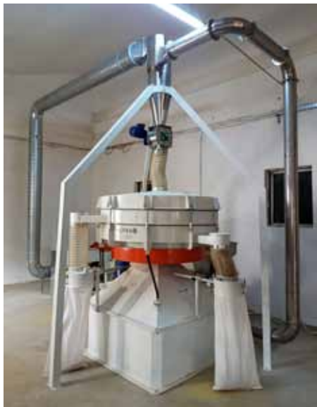
Slika 7. Rotacijsko-planetarno sito

Ovaj tip sita namijenjen je za razdvajanje materijala na dvije do pet frakcija, zavisno od broja ugrađenih umetaka (etaža). Mnoge su prednosti planetarnih sita, kao npr. visoka kvaliteta prosijavanja, tih i miran rad, potpuna zatvorenost (što je važno jer nema prašenja) i visoka produktivnost i pouzdanost u radu.