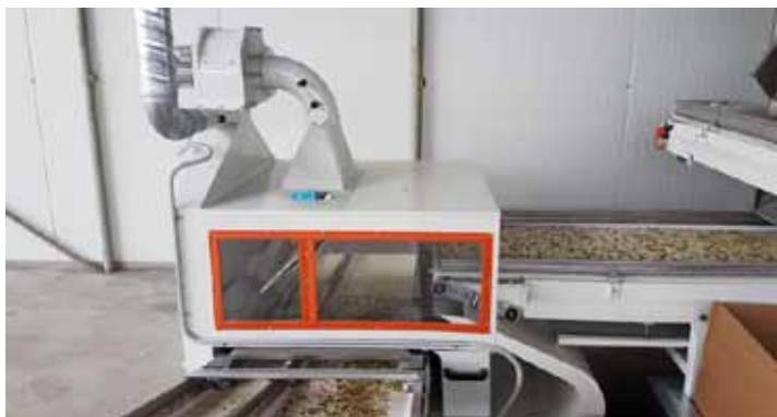
Slika 8. Pneumatski separator

Pneumatski separator namijenjen je za zračno odvajanje cvatova kamilice od prema težini pojedinih frakcija. Primjese mogu biti u obliku primjese zemlje, kamena, metalnih ostataka, a efektivno odvaja i čestice prašine. Pneumatski separator opremljen je ventilatorom s podešavanjem brzine strujanja zraka, čime se precizno može regulirati kvaliteta odvajanja pojedinih frakcija.