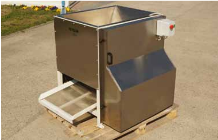
Slika 5. Odvajač glavica cvijeta kamilice