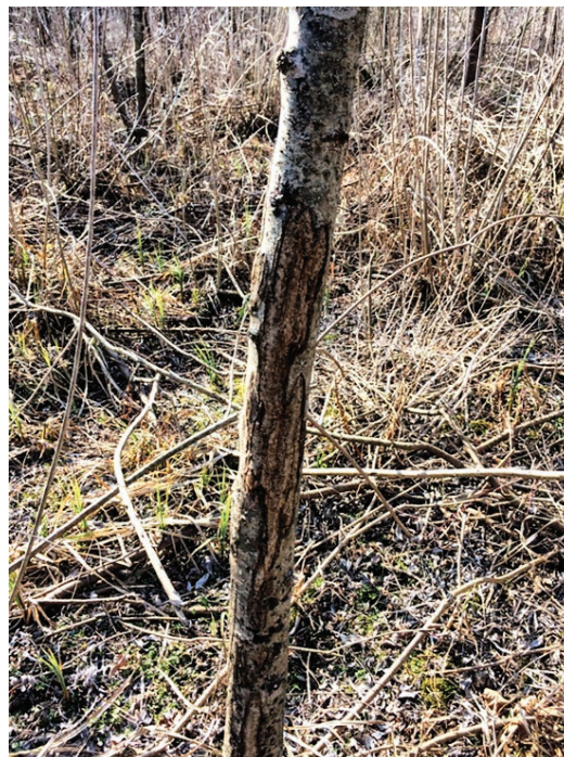
Slika 3. Štete od jelenske divljači na kori stabala poljskoga jasena, G.j. Josip Kozarac, Lovište III/39 OPEKE II

Porastom promjera raste i ukupna duljina oštećenog dijela kore na obje istraživane lokacije (Slika 5). Razloge i ovdje treba tražiti u višegodišnjem uzastopnom oštećivanju istog stabla. Intenzivna oštećivanja počinju kod prsnog promjera