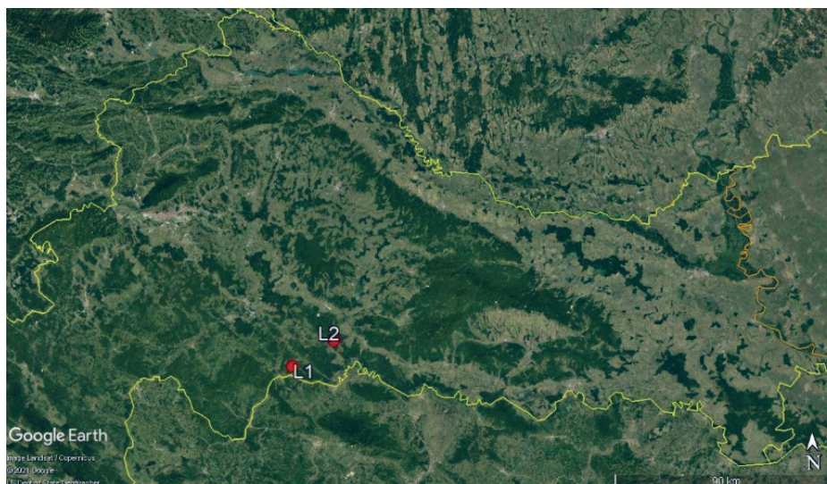
Slika 1. Lokacije sastojina poljskoga jasena odabrane za istraživanje (L1 – UŠP Sisak, šumarija Sunja, G.j. Posavske šume; L2 – UŠP Zagreb, šumarija Lipovljani, G.j. Josip Kozarac)

Figure 1. Locations of narrow-leaved ash stands chosen for the research (L1 – forest administration Sisak, forestry office Sunja, management unit Posavske šume; L2 – forest administration Zagreb, forestry office Lipovljani, management unit Josip Kozarac)