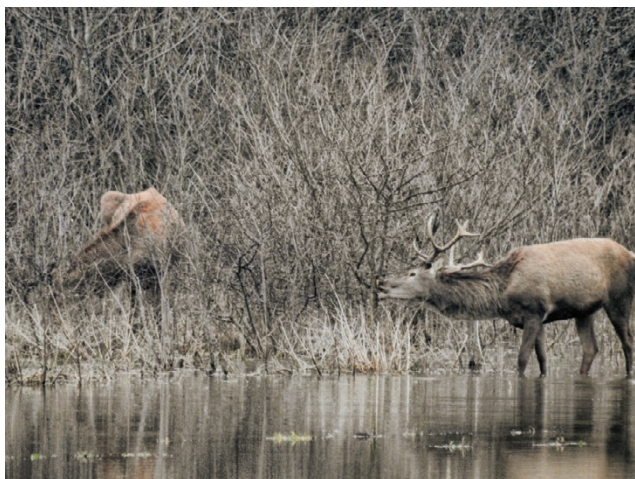
Slika 2. Guljenje kore na mladim stablima poljskoga jasena ( Fraxinus angustifolia Vahl) od strane jelena običnog ( Cervus elaphus L.) unutar G.j. Josip Kozarac, Lovište III/39 OPEKE II

Figure 2: Peeling of bark on young narrow-leaved ash trees ( Fraxinus angustifolia Vahl) by red deer ( Cervus elaphus L.) inside management unit Josip Kozarac, hunting ground III/39 OPEKE II