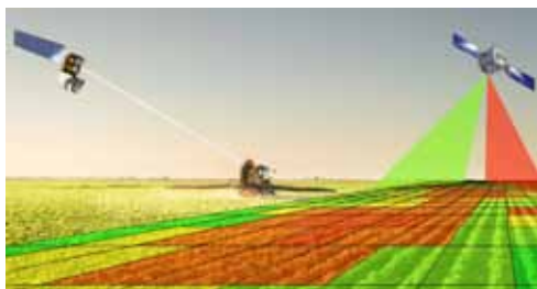
Slika 6. Telematski sustavi pri zaštiti bilja Picture 6. Telematic systems in plant protection