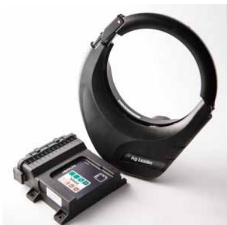
Slika 2. Hidraulično upravljanje Picture 2. Hydraulic steering