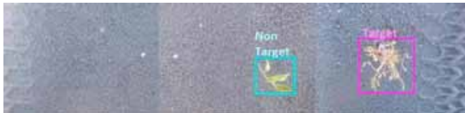
Slika 11. Pametno otkrivanje korova za apliciranje i biljke (Partel i sur., 2019)