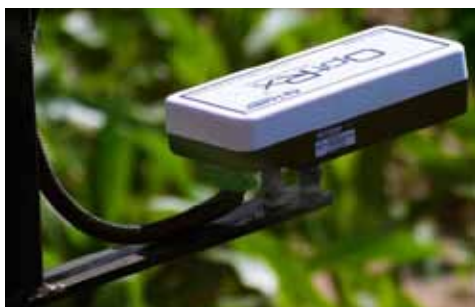
Slika 4. Bazna stanica Picture 4. Base station