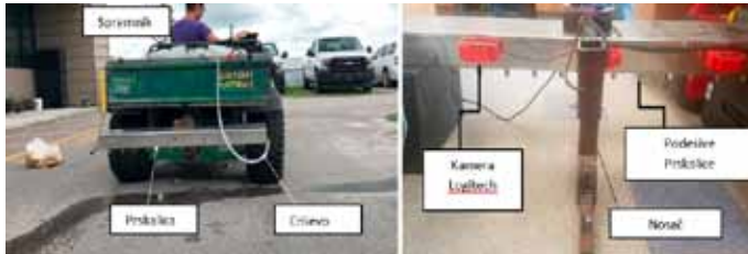
Slika 10. Pametna prskalica montirana na terensko vozilo (Partel i sur., 2019)

Jedan od suvremenih primjera zaštite bilja od korova je upotreba Smart Sprayer-a odnosno sustava koji se zasniva na strojnom učenju (machine learning). Smart Sprayer sadrži mlaznice, crpku, RTK GPS (točnost oko 2 cm), tri video kamere (Webcam Logitech c920), pametni kontroler (Arduino mega) za upravljanje svim sensorima i aktuatorima (npr. crpka), računsku jedinicu (NVIDIA Jetson TX2 GPU) za obradu slike i detekciju korova (Slika 10.). Kako bi se postigla precizna aplikacija i kreirala aplikacijska karta (karta korova) razvijen je program korištenjem C programskog jezika. Softver radi u stvarnom vremenu i može obraditi do 28 sličica u sekundi u svim koracima zajedno: akvizicija slike, detekcija objekata i komunikacija. Za preciznu mrežnu detekciju upotrebljava se YOLOv3 (Slika 11.)