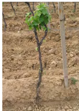
Slika 3. Primjer oštećenja korijena obradom tla

Osim neposredne koristi za okoliš, klimu i bioraznolikost, važne su i druge prednosti zatravljanja, kao što su: