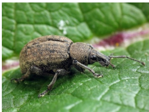
Slika 4. Lucernina velika pipa. Figure 4. Otiorhynchus ligustici.

Tijelo lucernine velike pipe je dugačko 10 do 14 mm, nema krila pa ne leti (Maceljčki, 2002). Smeđe je boje i pokrile joj je sraslo (Slika 4.). Odrasli oblici se javljaju u travnju. Hrane se noću, a tijekom dana se zakopavaju u tlo. Hrane se vršnim dijelovima stabljike i tako čine štete na odraslim biljkama. Ženke odlažu 200-400 jaja u površini tla. Ličinke prezime prvu godinu, a iduće godine nastavljaju s ishranom te se iste godine kukulje u tlu, dok odrasli oblici iz tla izlaze idućeg proljeća. Razvoj jedne generacije lucernine velike pipe traje dvije godine. Ličinke se hrane korijenom biljke pritom čineći jako velike štete. Praćenje se obavlja lovnim posudama (Maceljčki, 2002).