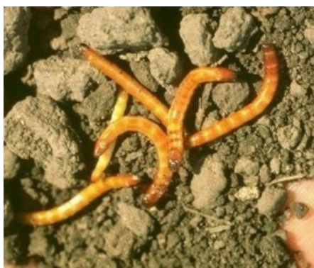
Slika 8. Žičnjaci. Figure 8. Elateridae.

Klisnjaci su štetnici uskoga tijela, dugački 7 do 15 mm, tamne boje. Na trbušnoj strani imaju izraslinu koja ulazi u otvor na zatku koja im omogućuje ako padne na leđa da skoči u zrak i vrati se na noge. Ličinke (žičnjaci) su žute boje, duljine oko 35 mm, imaju usko, izduženo i tvrdo tijelo (Kozina i Bažok, 2013) (Slika 8.). Embrionalni razvoj traje 2 do 4 tjedna. Ženka odloži u tlo 70 do 500 jaja. Kukuljenje traje 2 do 4 tjedna. Za razvoj su potrebne su minimalne temperature od 10 °C. Praćenje žičnjaka se obavlja kopanjem jama ili ukopavanjem zrnatih mamaca koji privlače ličinke, a za praćenje odraslih koriste se feromoni. Žičnjaci se hrane korijenjem biljaka, sjemenom i tek izniklim biljkama. Oni su najveći štetnici ratarskih usjeva. Kod jačeg napada mogu oštetiti mlade biljčice te se usjev mora ponovno presijavati. Najjači napada se može pojaviti nakon preoravanja usjeva (Maceljski, 2002).