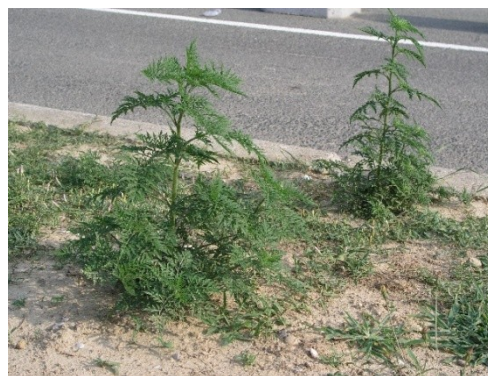
Slika 3. Ambrozija uz rub ceste (Foto: Z. Ostojić, lipanj, 2006). Figure 3. Common ragweed along the roadside (Photo: Z. Ostojić, June, 2006).