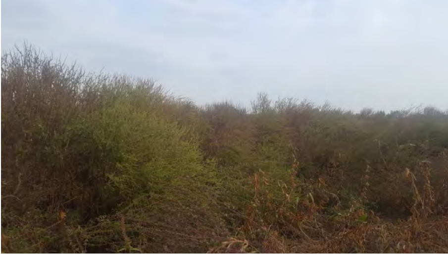
Slika 3. Usjev soje zakorovljen populacijom ambrozije rezistentne na herbicid okasuslfuoron na lokaciji Johovec

Za razliku od divljeg sirka kojemu je u Europi već dokazana rezistentnost na ALS herbicide, podataka o rezistentnim populacijama ambrozije u Europi nema. Stoga su ovi nalazi o rezistentnim populacijama ambrozije na ALS herbicide u Hrvatskoj i prvi službeni nalazi za tu vrstu u Europi (slika 2).