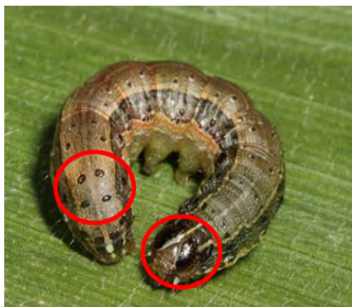
Slika 2. Gusjenica jesenske sovnicice

koja su obično tamne boje (Capinera, 2017.). Jesensku sovnicu najlakše se može prepoznati u stadiju već odrasle gusjenice koja ima četiri crne točkice u obliku kvadrata na zadnjem segmentu tijela i oznaku u obliku slova Y na glavi (slika 2). Kukuljice su crvenkastosmeđe boje i najčešće se mogu naći u tlu. Odrasli leptiri najaktivniji su uvečer i noću kada mogu preletjeti udaljenosti do 100 km. Tijekom dana odrasli su skriveni između listova kukuruza ili u pazušcu lista. Raspon krila leptira iznosi od 32 do 40 mm, te je prisutan spolni dimorfizam (Visser, 2017.).