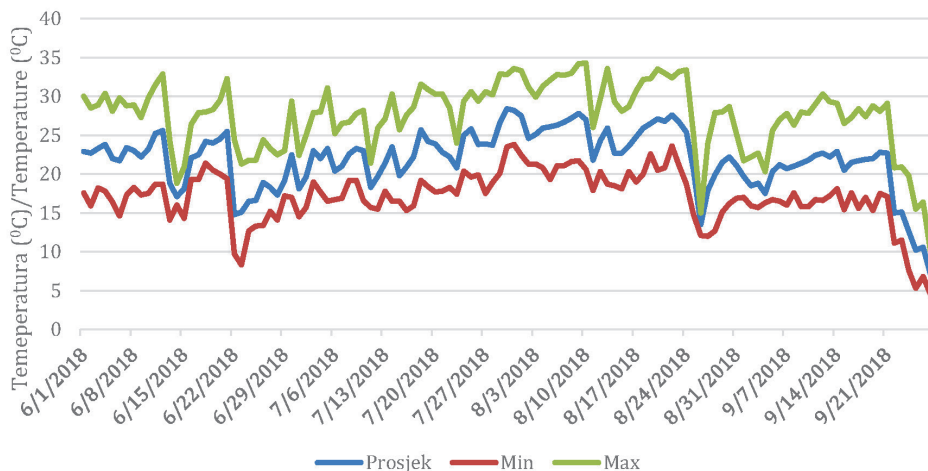
Grafikon 1. Dnevna temperatura zraka (C°) Graph 1 Daily air temperature (C°)

Za potrebe ovoga istraživanja obavljena su mjerenja dnevne temperature zraka (C°) i intenziteta UV zračenja (W/m 2 s). Sva potrebna mjerenja obavljena su na meteorološkoj stanici koja se nalazi u sklopu pokušališta „Jazbina“. Temperatura zraka mjerila se u periodu od 01.06. (prvo uzorkovanje je bilo 20.06) do 27.09. (zadnje uzorkovanje bilo je 13.09.) Minimalne, maksimalne i srednje dnevne temperature zraka za navedeni period mogu se očitati na Grafikonu 1.