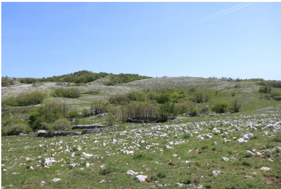
Slika 2. Kamenjarski pašnjaci na vrhu Plominske gore