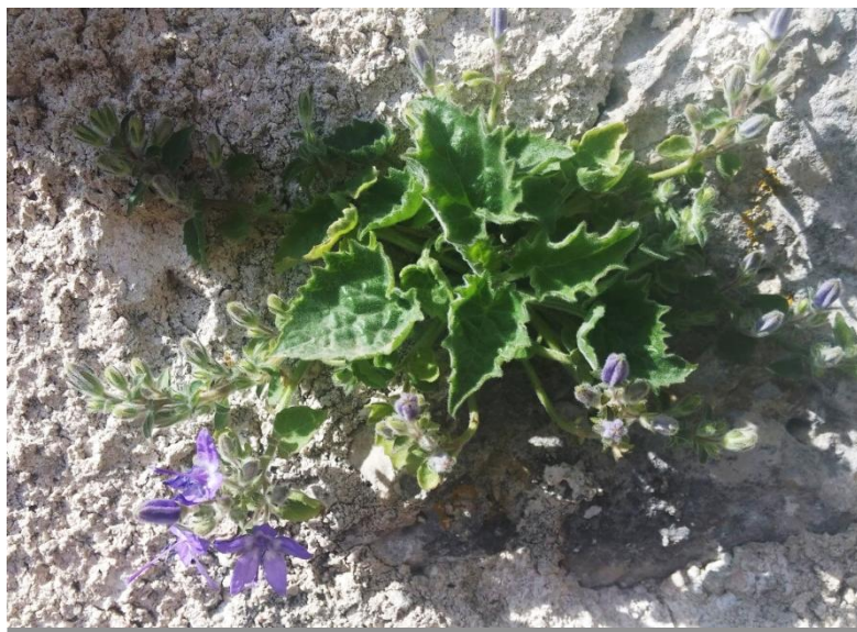
Slika 6. Subendemična Campanula fenestrellata Feer ssp. istriaca (Feer) Damboldt - istarski zvončić, obrašta zidine starog grada Plomina te obilno cvate kraje travnja

Osim ove vrste, na širem području Plominske gore i PP Učka rastu još dvije endemične biljne vrste, obje su gotovo ugrožene (NT) svojte: Campanula tommasiniana C. Koch (Tomasinijev zvončić) i Campanula justiniana Witasek (Justinijanov zvončić). Na Učki raste Leontopodium alpinum Cass. ssp. krasense Derganc (krški runolist), varijetet s Dinarskoga gorja (Šugar, 1971) koji spada u kategoriju osjetljiva (VU) svojta te endemična vrsta Dinarskoga gorja Berberis croatica Horvat (hrvatska žutika) spada u gotovo ugrožene (NT) svojte Hrvatske flore. Do nedavno se smatralo da hrvatska žutika pripada vrsti s obronaka Etne, i stoga je bila opisana pod imenom etnanske žutike ( Berberis aetnensis C.Presl) (Bertoša i Matijašić, 2005; Turnšek i sur., 2006).