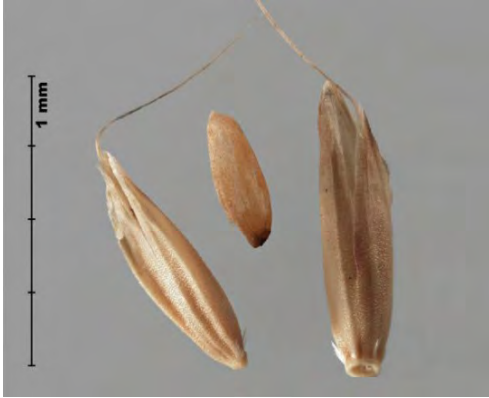
Slika 1. Izgled sjemena korovne vrste Alopecurus myosuroides

Figure 1. Alopecurus myosuroides seed