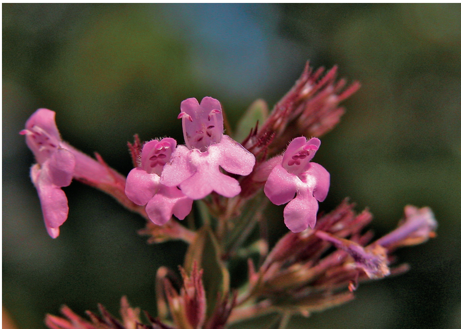
Slika 2. Micromeria croatica – cvijet; Kremer, 2015.