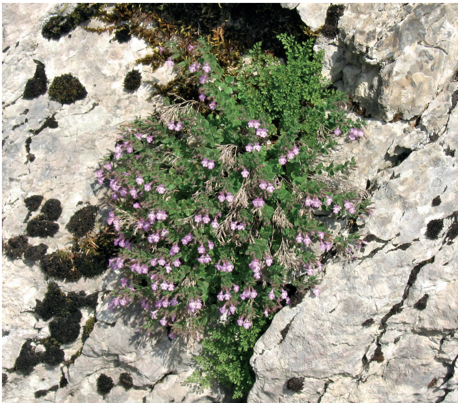
Slika 3. Micromeria croatica na prirodnom staništu; Kremer, 2015.