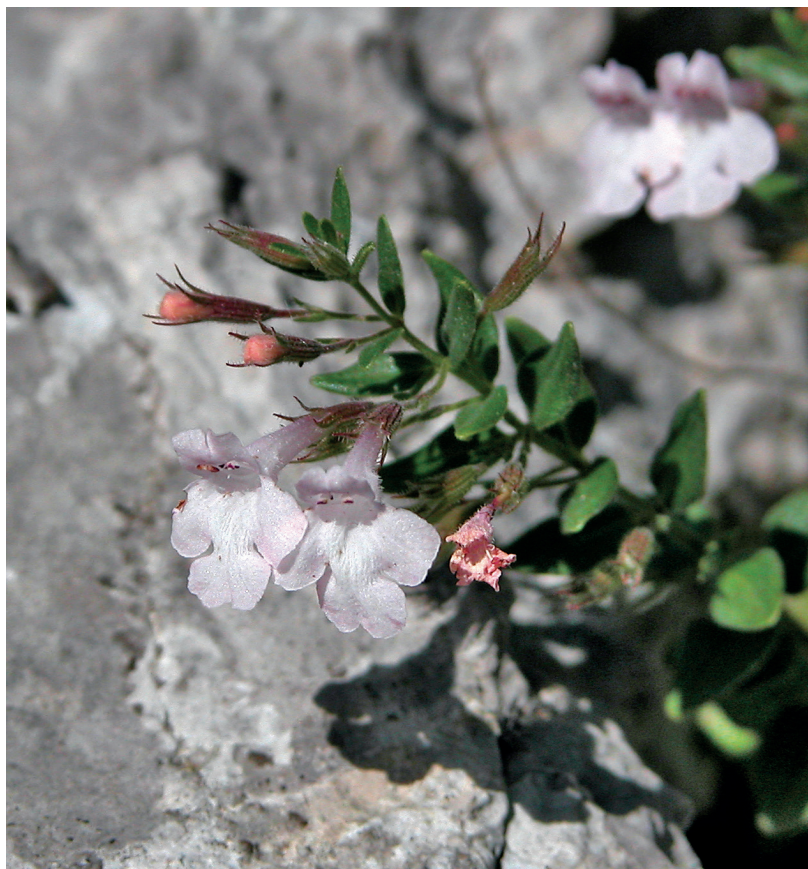
Slika 4. Micromeria croatica – jedinka bijele boje cvjetova; Kremer, 2015.

dužina lista a prosječno najveću varijabilnost za svojstvo dužina cvjetne stapke. U provedenom istraživanju, svojstva cvijeta varirala su više od svojstava lista. Za ukrasne svrhe, naročito se istaknula jedna jedinka unutar populacije kod koje je izmjeren najveći prosječni broj cvjetova na izbojku i to čak 40. Izdvojena jedinka imala je ujedno i prosječno najkraću čašku, najkraće zupce čaške i najkraće brakteje u odnosu na ostale biljke. Kremer i Krušić Tomaić (2015.) te Kremer i sur.(2019.) navode i biljke s bijelim cvjetovima koji se u hrvatske bresine vrlo rijetko razvijaju (Slika 4). Ovakve, fenotipski interesantne jedinke, dobra su podloga za daljnju selekciju i razmnožavanje.