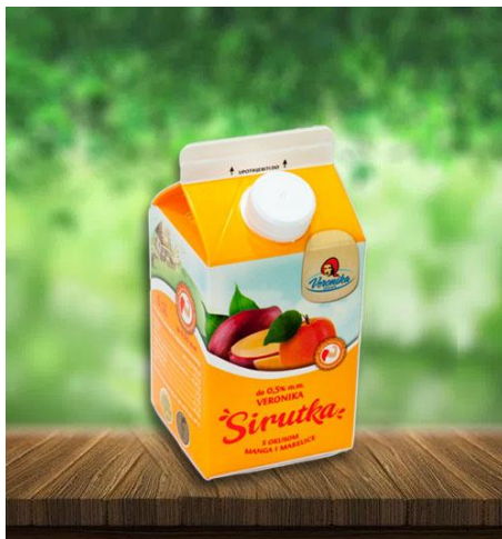
Slika 2.2.4. Sirutka s okusom manga i marelice

U Hrvatskoj aromatizirane sirutke proizvode mljekara Meggle i Veronika. Problem korištenja sirutke u proizvodnji napitka duljeg roka trajanja je stvaranje taloga zbog denaturacije proteina sirutke i taloženja mineralnih tvari (Tratnik, 2012.).