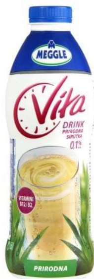
Slika 2.2.5. Meggle Vita sirutka