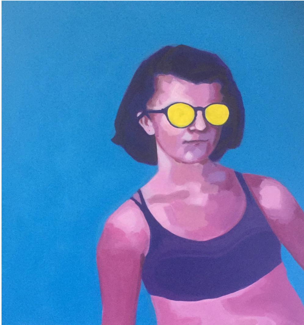
Ana , 2018., kombinirana tehnika