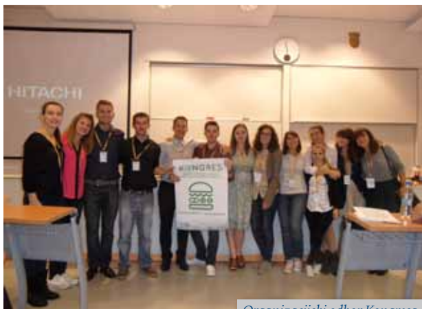
Organizacijski odbor Kongresa

Udruga studenata farmacije i medicinske biokemije Hrvatske ove godine organizirala je svoj prvi