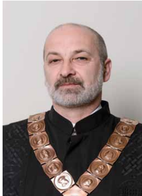
prof. dr. sc. MILOŠ JUDAŠ prorektor za znanost, međuinstitucijsku i međunarodnu suradnju Sveučilišta u Zagrebu

Rođen je 1962. u Vinkovcima. Diplomirao je klavir na Royal College of Music u Londonu sa samo 19 godina kao najmlađi diplomant u povijesti ove institucije. Završio je poslijediplomski studij klavira na Muzičkoj akademiji Sveučilišta u Zagrebu. Suradivao je s brojnim istaknutim svjetskim umjetnicima i pedagogima, a posebno je značajna njegova profesionalna suradnja s britanskim orguljašem i pijanistom Wayneom Marshallom s kojim već dugo godina uspješno nastupa. Bio je prodekan za međunarodnu suradnju i informatiku (od 2001.) te dekan Muzičke akademije Sveučilišta u Zagrebu u dva mandata. Začetnik je suradnje triju umjetničkih akademija Sveučilišta u Zagrebu, čime je osnažen utjecaj umjetničkog područja na razini Sveučilišta te obogaćen kulturni život Grada Zagreba. Obnašao je funkciju člana Kulturnog vijeća za glazbu pri Ministarstvu kulture Republike Hrvatske, bio je CMU koordinator pri CARNet-u, 2009. imenovan je članom Matičnog odbora za umjetnost pri Ministarstvu znanosti, obrazovanja i sporta, a odlukom Sabora Republike Hrvatske u listopadu 2011. imenovan je članom Nacionalnog vijeća za znanost. Dobitnik je brojnih nagrada i priznanja. Dao je poseban doprinos u realizaciji projekta izgradnje nove zgrade Muzičke akademije Sveučilišta u Zagrebu.