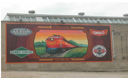
Slika 8. Ručno izrađen vagon u Lincolnu