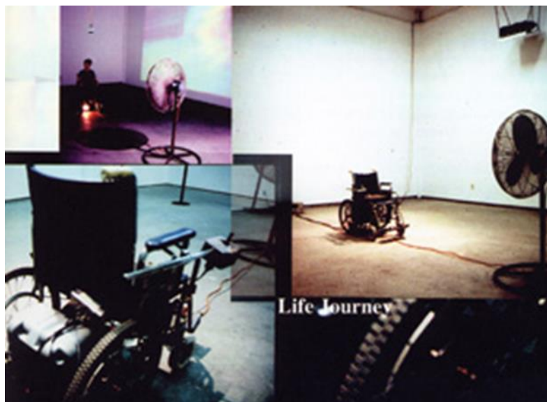
Slika 6: „Životni put“ (Izvor: Disability in the arts, Berge, 1997.)

njezinog uspjeha kao umjetnice. Jon K. Berge umjetnik je koji se bavio temom invaliditeta u svojim radovima, primjer toga je njegova instalacija "Životni Put" čiji je cilj bilo pružanje virtualnog iskustva za gledatelje. "Životni Put" interaktivna je instalacija koja direktno suočava gledatelja s ograničenjima invalidskih kolica (Berge, 1997). Djelo stavlja u kontrast nepokretnost sudionika dok sjedi nepomičan u stolici koja je pričvršćena za pod, s iluzijom brzog putovanja, kreirana uz pomoć projekcija na zidovima koji se nalaze na drugoj strani, uz zvukove pokreta i simulirani nalet vjetra uz pomoć podnog ventilatora (Berge, 1997).