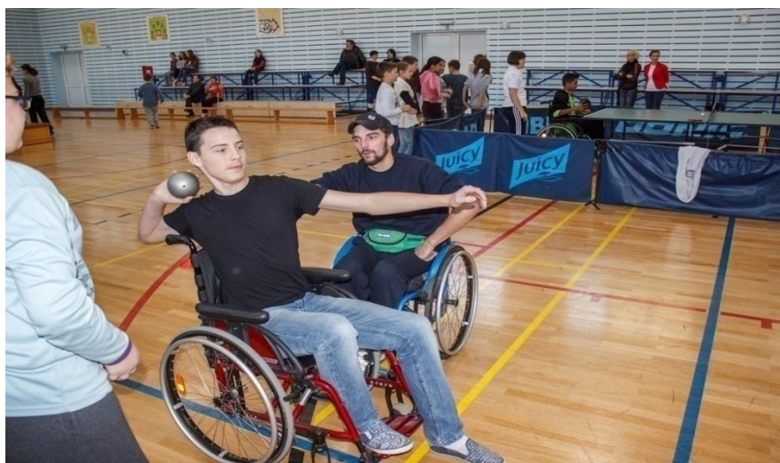
Slika 3: Učenik baca lopticu u dalj

U radu s učenicima s teškoćama u razvoju bitno je dobro upoznati pojedino dijete i voditi se mišlju da granice koje može prijeći pojedino dijete ne postoje – sve što dijete napravi u području svog tjelesnog razvoja sigurno će utjecati na unaprjeđenje zdravstvenog statusa (Trajkovski-Višić, Podnar i Mraković, 2010). Budući da neka istraživanja upućuju na to da se tjelesnim vježbanjem najviše može poboljšati kardiovaskularna izdržljivost djece s niskim motoričkim kompetencijama, a toj kategoriji pripadaju i neka djeca s lakšim teškoćama u razvoju (Hands, 2008), djeci to treba i omogućiti i stvoriti navike za redovitim vježbanjem, čak i onda kada nisu uključena u neke od grupnih programa tjelesnog vježbanja. Slika 3 prikazuje učenika u kolicima koji na nastavi Tjelesne i zdravstvene kulture baca lopticu.