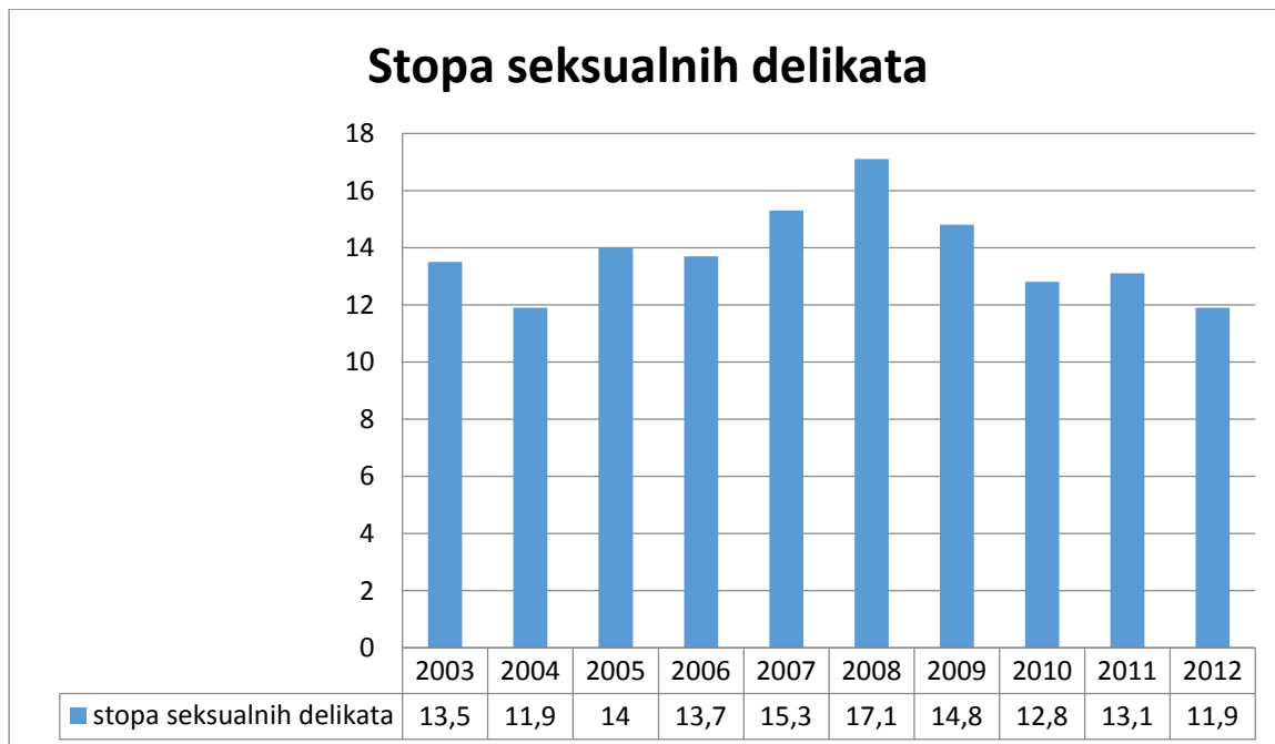
Grafikon 3. Stopa seksualnih delikata

Prema podacima iz Grafikona 3. stopa seksualnih delikata bila je najzastupljenija 2008. godine sa 17,1%, dok je u 2004. i 2012. sa 11,9 % najmanje zastupljen.