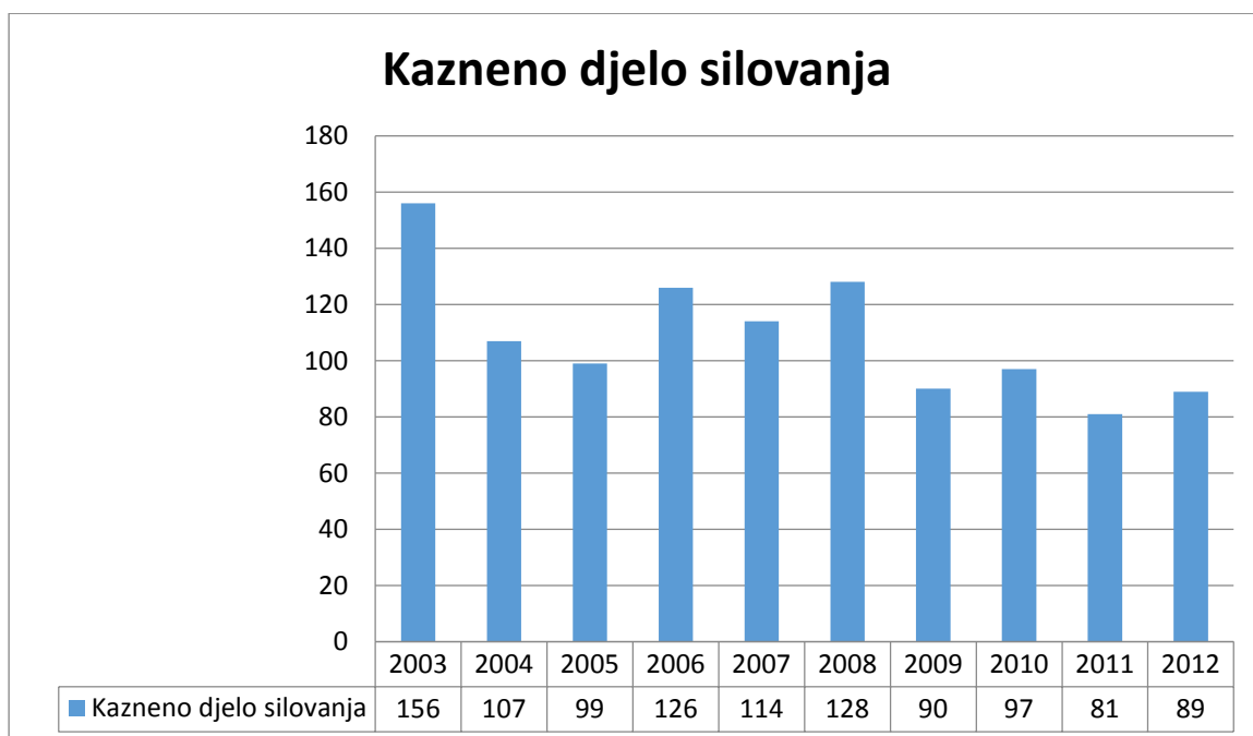
Grafikon 2. Kazneno djelo silovanja, uključujući i pokušaj

Kaznenog djela silovanja najviše je bilo u 2003. godini (156), slijedi je 2008. godina (128) dok je u 2012. zabilježeno 89 slučajeva (Grafikon 2.).