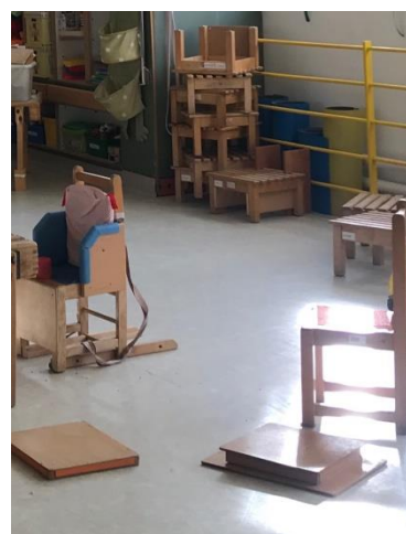
Slika 4 Stolice različitih stupnjeva potpore te drveni blokovi (stepenice)