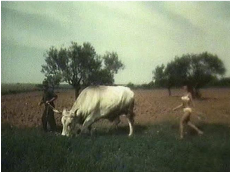
17. Sunčani Jadran

ponude odjednom se, bez naratorova komentara, pojavi prizor seljaka koji ore uz pomoć vola, a kraj njega pritom hoda turistkinja u bikiniju (fotografija 17). Nakon nekog vremena pojavi se i prizor turistkinje u bikiniju koja po pješčanoj plaži vodi jarca za uzicu. Ove bizarno smiješne antiteze pokazatelj su stilske slobode kozerijskog filma u kojem je ponekad sve dopušteno.