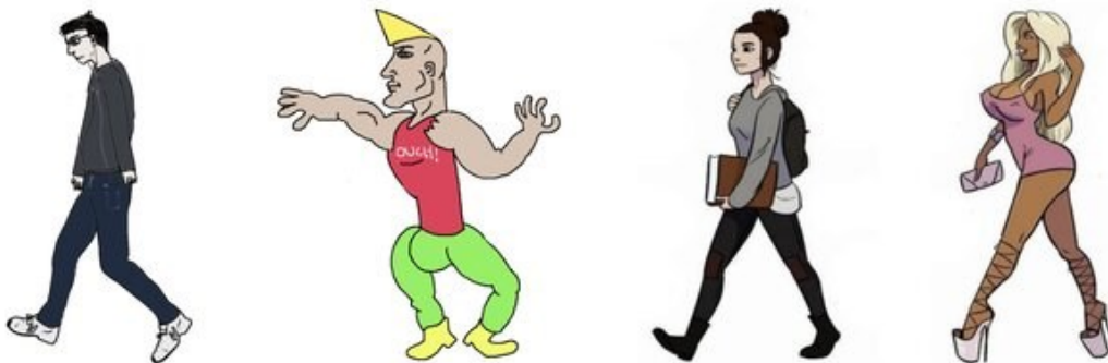
Slika 2: popularni prikazi (s lijeva na desno) incela, Chada, Becky i Stacy (preuzeto iz: Gothard et al. 2021: 3).

Stacy: ženska verzija Chada. Zgodna žena (obično plavokosa bjelkinja) koja će uvijek izabrati Chada za svog partnera. Za nju inceli smatraju da je isprazna, glupa, promiskuitetna i materijalistički nastrojena. Stacy se optužuje da će oko sebe zadržavati „roj“ muškaraca (incela ili muškaraca nižih na ljestvici od Chada) koji će joj pružati pažnju, ali ih ona nikada neće izabrati za romantičnu ili spolnu vezu (Stacy 2023).