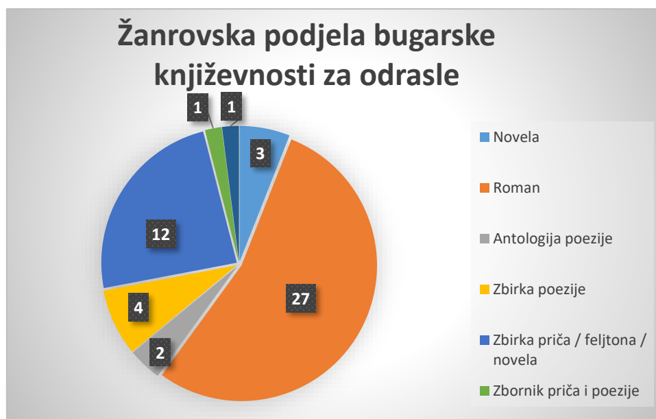
Grafikon 2. Žanrovska podjela bugarske književnosti za odrasle

Dvije antologije poezije u cijelosti posvećene su bugarskim pjesnicima - Bugarske pjesme (1886.) i Pregled bugarske poezije 19. i 20. stoljeća (2012.). Objavljene su i četiri autorske pjesničke monografije: Poezija Penje Peneva (1971.), Viteški zamak Hrista Jasenova (2006.), Hodočasnik svjetla Romana Kisjova (2008.) te Divlja priroda Beloslave Dimitrove (2017.).