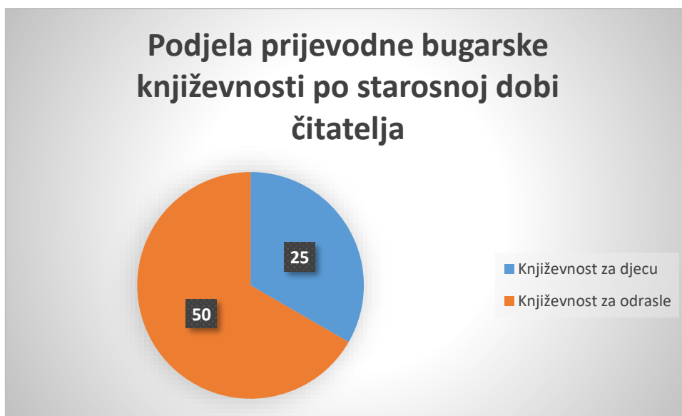
Grafikon 1. Podjela prijevodne bugarske književnosti po starosnoj dobi čitatelja

Podrobnijom analizom bibliografije može se ustvrditi da su u razdoblju od 1886. godine do 2021. godine obuhvaćeno devedeset osam bibliografskih jedinica, od čega se dvadeset tri bibliografske jedinice odnose na različite antologije poezije ili zbirke pripovijedaka u kojima je zastupljen po jedan ili više bugarskih autora. Izuzmemo li bibliografske jedinice koje se odnose na takve zbirke ili antologije i analiziramo li ovih 75 jedinica koje u cijelosti donose prijevode bugarskih autora, možemo ustvrditi da prijevodna književnost za djecu i mladež obuhvaća 25 bibliografskih jedinica; dok se 50 jedinica odnosi na književnost za odrasle.