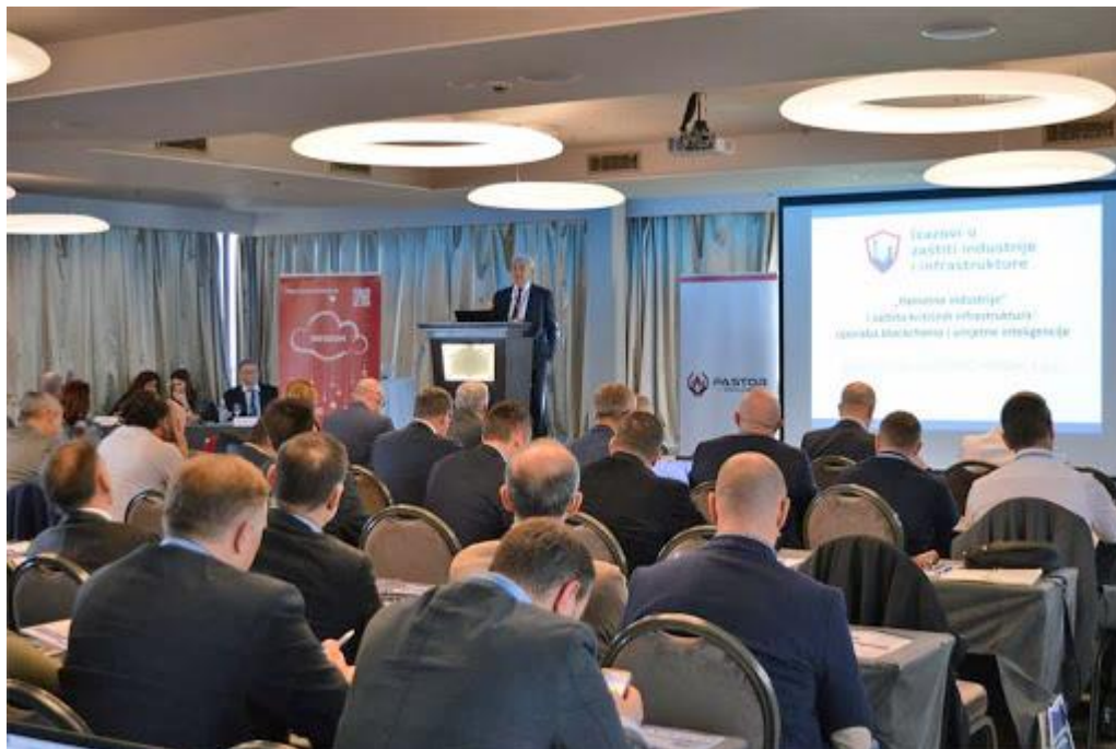
Slika 4. InfoDom d.o.o

Uvidom u financijske izvještaje poduzeća InfoDom d.o.o. uočeno je da najznačajniji dio imovine čini nematerijalna imovina što je u skladu obzirom na djelatnost koju poduzeće obavlja.