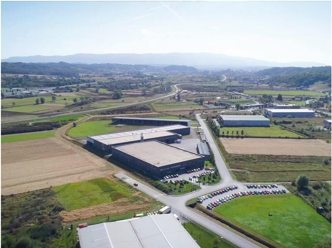
Slika 3. Prostorija d.o.o.

računovodstvenu politiku ne manipulira rezultatom s ciljem plaćanja nižeg iznosa poreza na dobit.