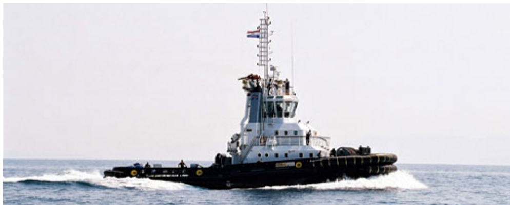
Slika 5. Tegljač Gea brodara Jadranski pomorski servis

Započinje sa radom 1956. godine, a dioničkim društvom postaje 1994. godine. Pruža usluge tegljenja, spašavanja, dizanja teških tereta pontonskom dizalicom, prijevoza nafte i naftnih derivata, a među osnovnim djelatnostima nalazi se i ekološka zaštita mora. Važan je čimbenik sigurnosti plovidbe na području sjevernog Jadrana, a najčešće intervenira pri odsukavanju nasukanih plovila, gašenju požara na brodovima i tegljenju onesposobljenih plovila do luka. Upravlja sa 11 tegljača, tri teglenice te jednom pontonskom dizalicom, ukupne tonaže 4907 GT i 3178 DWT.