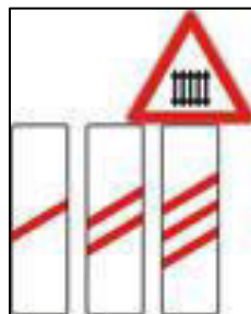
Slika 2. Približavanje željezničko-cestovnom prijelazu s branicima ili polubranicima [6]

Također, uz cestovnu prometnicu koja se približava željezničko-cestovnom prijelazu moraju se postaviti tri uzastopna prometna znaka na određenoj udaljenosti od prijelaza koji ukazuju na njegovu prisutnost. Prvi se znak s trima kosim crtama i odgovarajućim znakom opasnosti postavlja 240 metara ispred mjesta križanja cestovne prometnice i pruge. Drugi se znak s dvjema kosim crtama postavlja 160 metara prije križanja, dok se posljednji znak s jednom kosom crtom postavlja 80 metara prije željezničko-cestovnoga prijelaza (Slika 2. i 3.). [5]