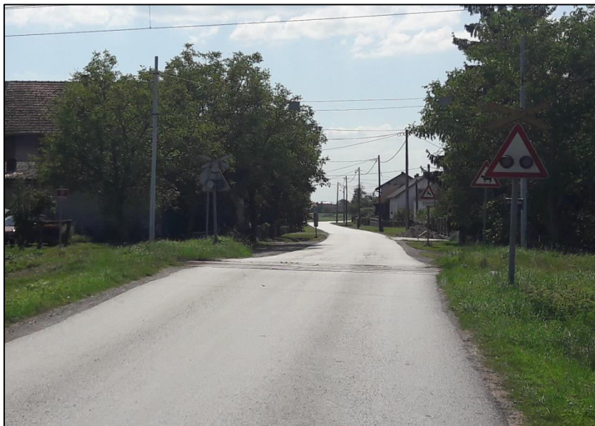
Slika 5. Željezničko-cestovni prijelaz osiguran sa svjetlosno-zvučnom signalizacijom i "Andrijinim križem", Okešinac