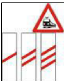
Slika 3. Približavanje željezničko-cestovnom prijelazu bez branika ili polubranika [6]

Trokut preglednosti omeđen je točkama A, B i C (Slika 4.). Točka B nalazi se ispred željezničko-cestovnoga prijelaza u osi kolnika ceste, u ravnini s prometnim znakom „Andrijin križ“ i prometnim znakom „Stop“, te se za nju određuje preglednost s ceste na željezničku prugu. Točke A i C nalaze se u osi željezničke pruge i na njima se iz točke B na cesti mora uočiti željezničko vozilo na željezničkoj pruzi. Točka S nalazi se u sjecištu osi kolnika ceste i osi željezničke pruge. Duljina m označava udaljenost „Andrijinog križa“ od sjecišta osi pruge i osi ceste (točka S). Oznaka n je minimalna udaljenost crte l koju cestovno vozilo mora prijeći da bi bilo izvan slobodnoga profila željezničke pruge [7].