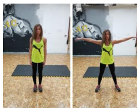
Slika 30. Jumping jack