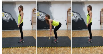
Slika 56. Tehnika izvođenja mrtvog dizanja s drvenom palicom ili s malom bučicom (4 kg)