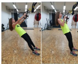
Slika 50. Podizanje tijela iz kosog visa – 45° (zgib) na trx-u- vježba za leđa