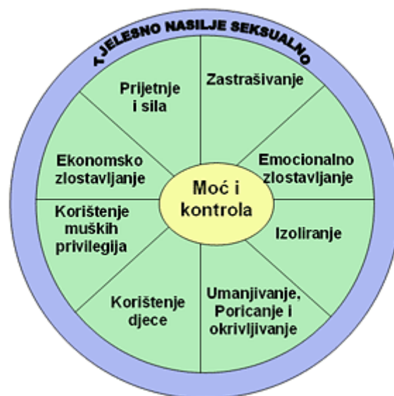
Slika 1. Kotač moći i kontrole (4)

Neovisno o autoru, iz definicije nasilja u obitelji vidljivo je da zlostavljač tijekom nasilnog partnerskog odnosa uspostavlja moć i kontrolu tijekom dužeg vremena, što je slikovito prikazano u "Kotaču moći i kontrole".