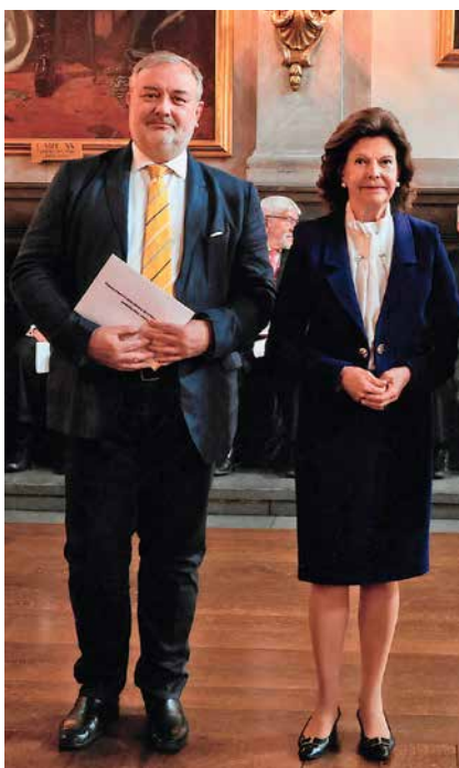
Sa švedskom kraljicom Silvijom na ceremoniji dodjele znanstvene potpore, 2023.

Ovih dana radim na karakterizaciji fibrilarnog oblika amiloida u krvi. To je dio naših istraživanja u kojima upotrebljavamo kompleksne nove fluorescentne probe za otkrivanje budućih biokemijskih biljega u krvi bolesnika koji imaju Alzheimerovu bolest. Za ovaj projekt sam, zajedno sa svojim suradnicima, dobio novčanu nagradu norveške fundacije Thon te financijsku potporu nekih švedskih znanstvenih i državnih zaklada.