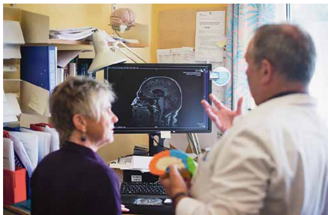
S pacijentom – objašnjavanje mozga, Oslo 2016.