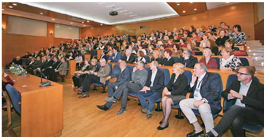
40-godišnjica generacije liječnika diplomiranih 1976., Hrvatski liječnički zbor 2016.

Jedan od glavnih ciljeva naše studentske organizacije bio je priprema skripta koje smo planirali tiskati na osnovi predavanja naših profesora. U to je vrijeme