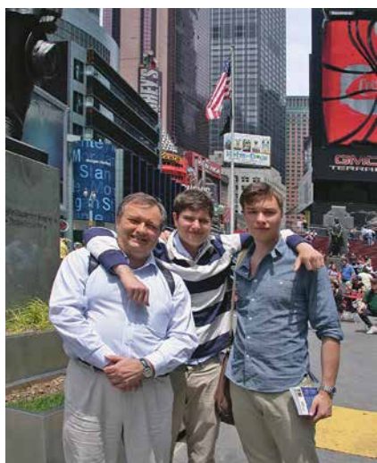
Sa svojim sinom 2011. u Velikoj Jabuci, gdje sam imao sjedište tvrtke