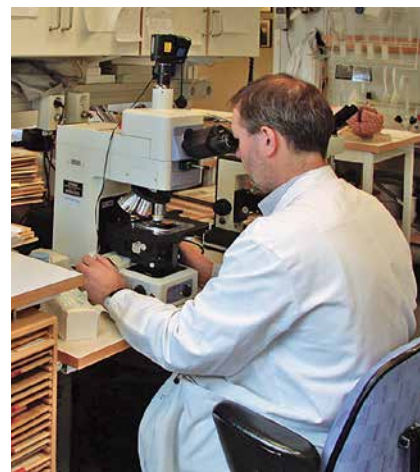
Radio sam tada, 2001., na najnaprednijem Nikonovom mikroskopu.

znanstvene skupove, a zatim sve veće konferencije, pa čak i godišnje regionalne sastanke za studente medicine i stomatologije. S vremenom su me kolege izabrale za studentskog predstavnika u Znanstveno-nastavnom vijeću Medicinskog fakulteta. Na tom sam Vijeću uspio postići neke stvari koje su se dotada činile nemogućima. Među inim, kad je 1981. sazvana skupština za inauguraciju novog vodstva Fakulteta, zahtijevao sam, u ime studenata, pravo da mi studenti imenujemo našega kandidata za prorektora za nastavu. Naš iznenadni zahtjev zatekao je profesore, koji nisu znali kako reagirati pa je Vijeće raspustilo našu studentsku delegaciju. Nakon toga su nas "pobunjenike" nadomjestili s novom ekipom, poslušnijih studenata u koje su imali povjerenja, kako bi sve opet moglo doći pod potpunu kontrolu fakultetske administracije. Kao primjer dovoljno je navesti da je studentski proračun bio mnogostruko povećan novoj