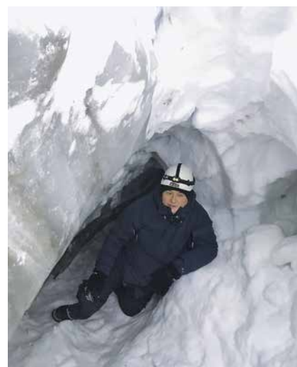
U dubinama ledenjaka na otoku Spitsbergen

interakcija mutiranog gena i APOE gena utječe na kliničko-morfološke značajke Alzheimerove bolesti. Na kliničkom planu izučavao sam razlike između Alzheimerove bolesti i demencije frontotemporalnog lobusa. Povezanost demencije i raznih poremećaja govora uvijek me zanimala i o tom sam problem napisao nekoliko radova.