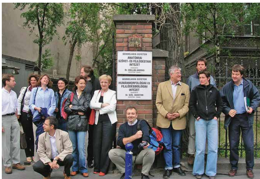
Znanstveni skup Brain Net Europe, Budimpešta 2005.