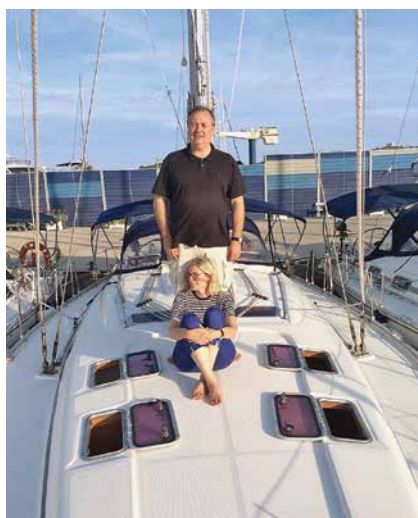
Sa svojom suprugom na ljetnim praznicima 2015.