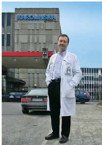
Ispred Karolinske bolnice 2006.

Prvi kritični trenutak kojega se sjećam bio je povezan s jednim tehničkim dostignućem tijekom moje prve godine u Švedskoj. Ništa posebno, ali ga se ipak sjećam jer mi je u tom trenutku mnogo značilo. U to vrijeme obavljao sam stereološke neurokirurške zahvate na Meynertovoj jezgri pokusnih životinja kako bi im smanjio kolinergičnu inervaciju mozga. Nakon operacije sam iz mozga napravio histološke rezove koje sam onda morao obraditi imunohistokemijski i na njima dokazati prisutnost enzima kolintransferaze. Laborantica, stručnjakinja za imunohistokemiju, pokušala je dokazati enzim, ali nije uspjela. Nakon nekoliko pokušaja zamolio sam ju da pokušam primijeniti svoje znanje iz Zagreba i da to učinim umjesto nje. Nakon nekoliko bezuspješnih pokušaja na kraju sam ipak uspio imunohistokemijski prikazati enzim u tkivu. Od silnog sam se uzbuđenja rasplakao. No sabrao sam se i zatim pokazao obojeno stakalce ostalim članovima grupe koji su mi čestitali na uspješno obavljenom poslu. Taj moj tehnički uspjeh donekle mi je poboljšao status unutar grupe, te sam preko noći od novopridošlog stranca postao redovnim članom laboratorija. Ujedno sam tada shvatio koliko mi je vrijedilo prethodno znanje doneseno iz Zagreba.