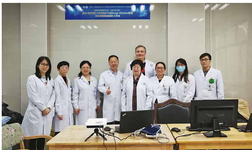
Na Neurološkoj klinici u Shenzenu, Kina, 2019.

Sudjelujem u dva velika projekta, BrainNet Europe i EUGMS. BrainNet Europe je stvoren kako bi tijekom 10 godina stvorio na 20 mjesta u Europi banke mozгова. Znanstvenici, kliničari i neuropatolozi iz raznih dijelova Europe radili su 10 godina na tom projektu i rezultate smo objavili u desetak radova. Glavna tema tih radova bila je standardizacija protokola za pregled mozgov a i usklađenje napora i poboljšanje komunikacije među sudionicima iz raznih zemalja. Glavni je cilj bio da