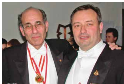
S Richardom Axelom, laureatom Nobelove nagrade za medicinu i fiziologiju, 2004.