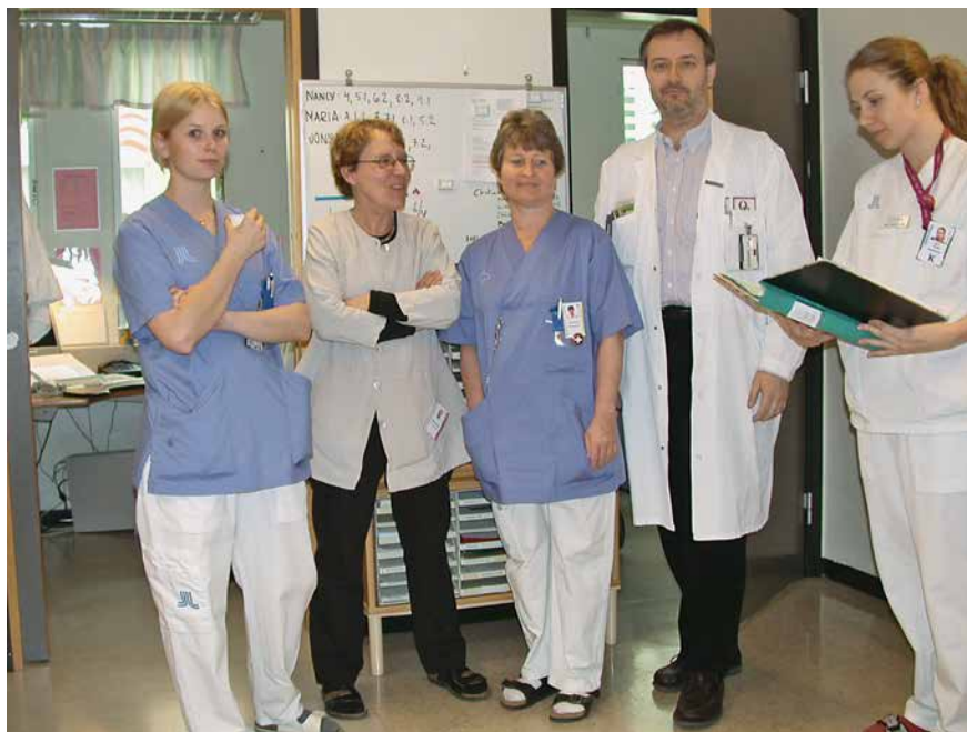
U mojem kliničkom odjelu 2006.

rali donijeti brzo – hoćemo li ostati ili ne. Najteže nam je pala pomisao da bismo na taj način morali ostaviti naše roditelje, ja i svoju sestru. Kako ostaviti Zagreb, naš grad, prijatelje, kolege i sve ono što smo imali u prethodnom životu? Profesionalno nije bilo problema jer sam imao zajamčen posao pa sam samo trebao nastaviti raditi na projektu koji sam bio započeo. No novi život u stranoj zemlji za moju cijelu obitelj nije bilo tako jednostavno zamisliti. Bez problema sam se uključio u švedski znanstveni i medicinski sistem. Ipak mi je trebalo vremena da se u cijelosti snađem i osamostalim na svojemu novom radnom mjestu. Trebalo mi je vremena da se počnemo sporazumijevati, da počnem shvaćati lokalne običaje, društvene konvencije i pravne detalje svoga zaposlenja. No sve u svemu, dobro je prošlo te smo sada postali dio njihovog društva.