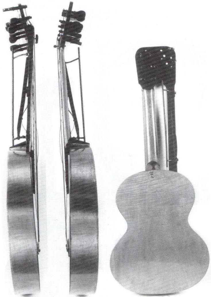
b. Bočne i stražnja strana