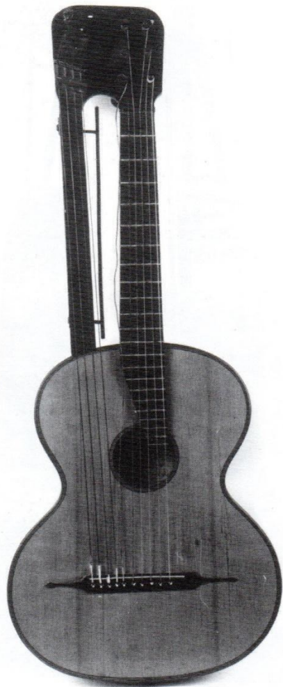
a. Prednja strana