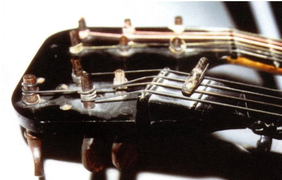
d. Prečka (kapodaster)