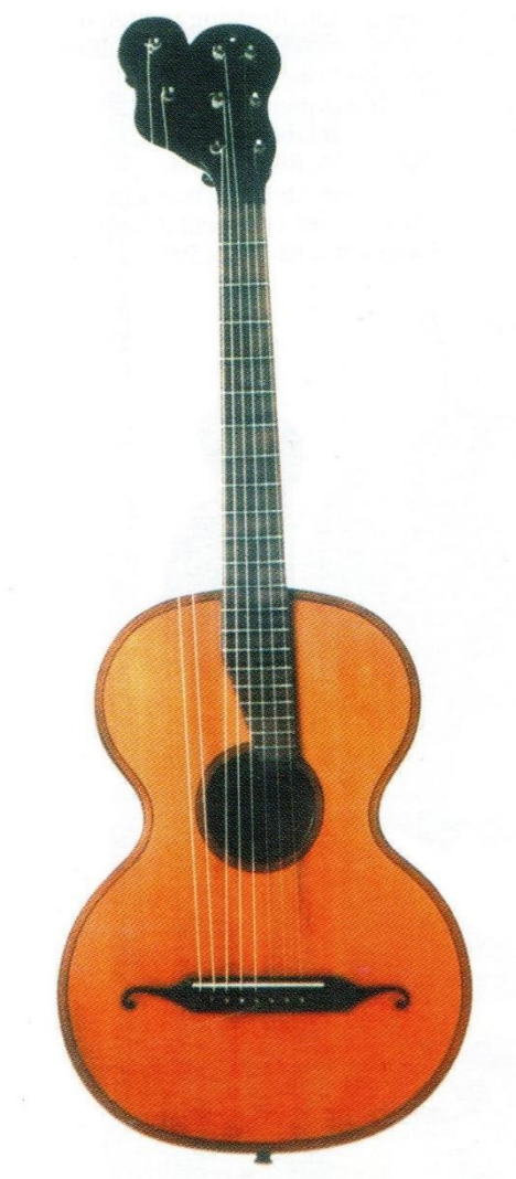
Slika 5. Gitara s osam žica, Legnanijev model graditelj: Nikolaus Georg Rieß, Beč, c. 1835.