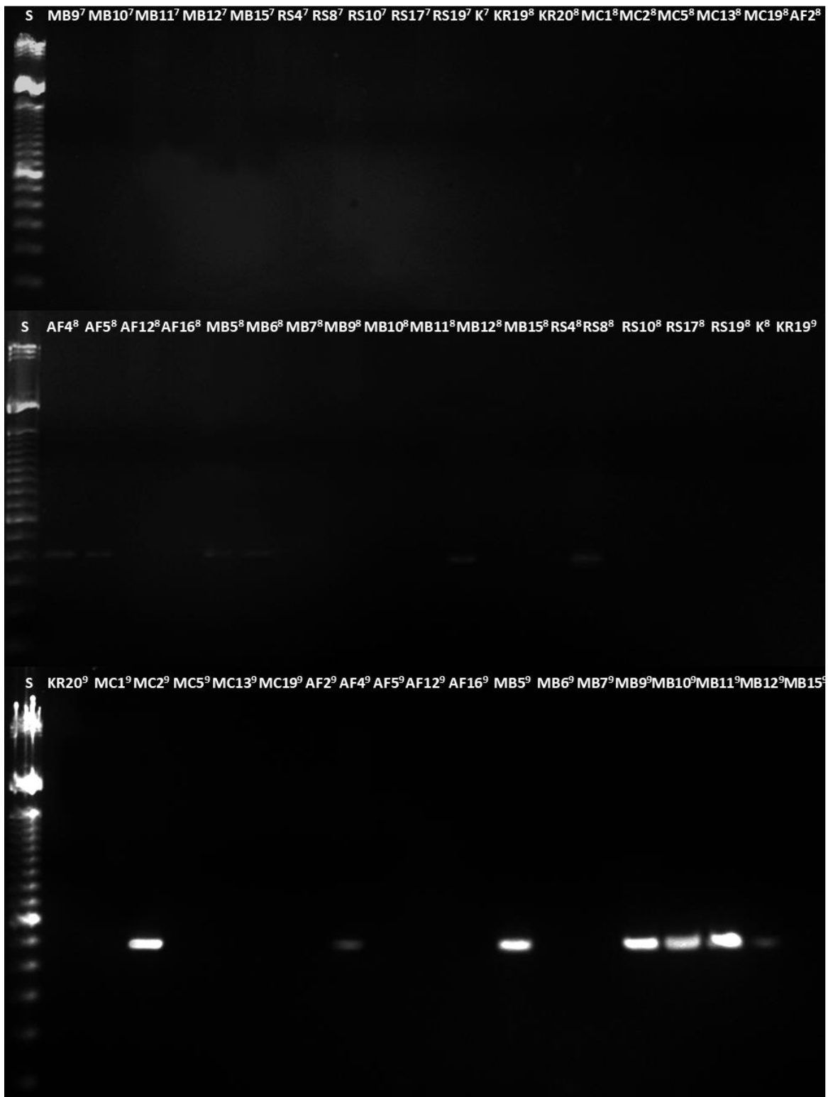
Slika 6. DNA elektroforeza produkata PCR reakcije sa specifičnim početnicama za gene rezistencije za streptomycin (7), ampicilin (8) i gentamicin (9).