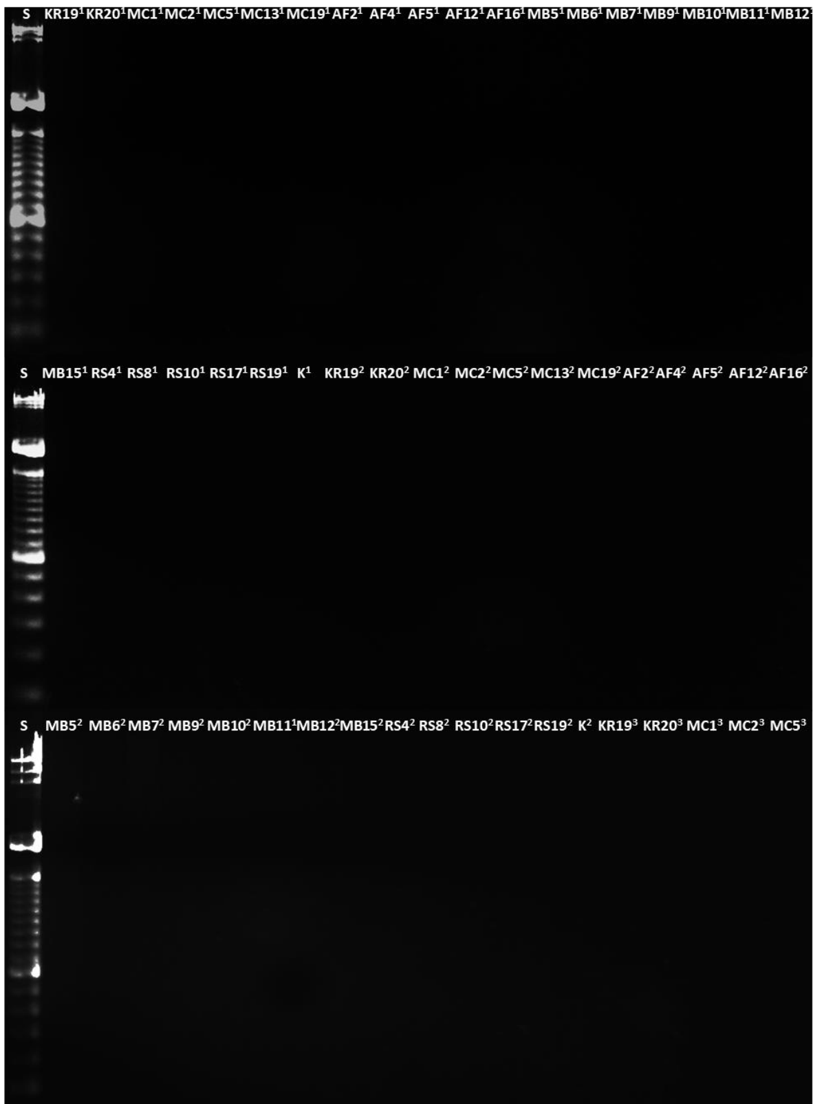
Slika 3. DNA elektroforeza produkata PCR (amplikona) reakcije sa specifičnim početnicama za gene koji kodiraju za rezistencije na klindamicin (1), eritromicin (2) i kanamicin (3).