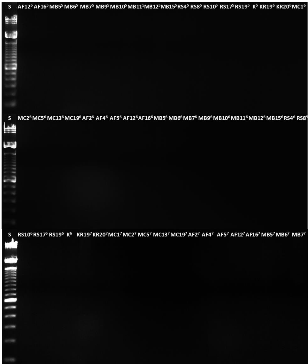
Slika 5. DNA elektroforeza produkata PCR reakcije sa specifičnim početnicama za gene rezistencije za tetraciklin (5), kloramfenikol (6) i streptomycin (7)