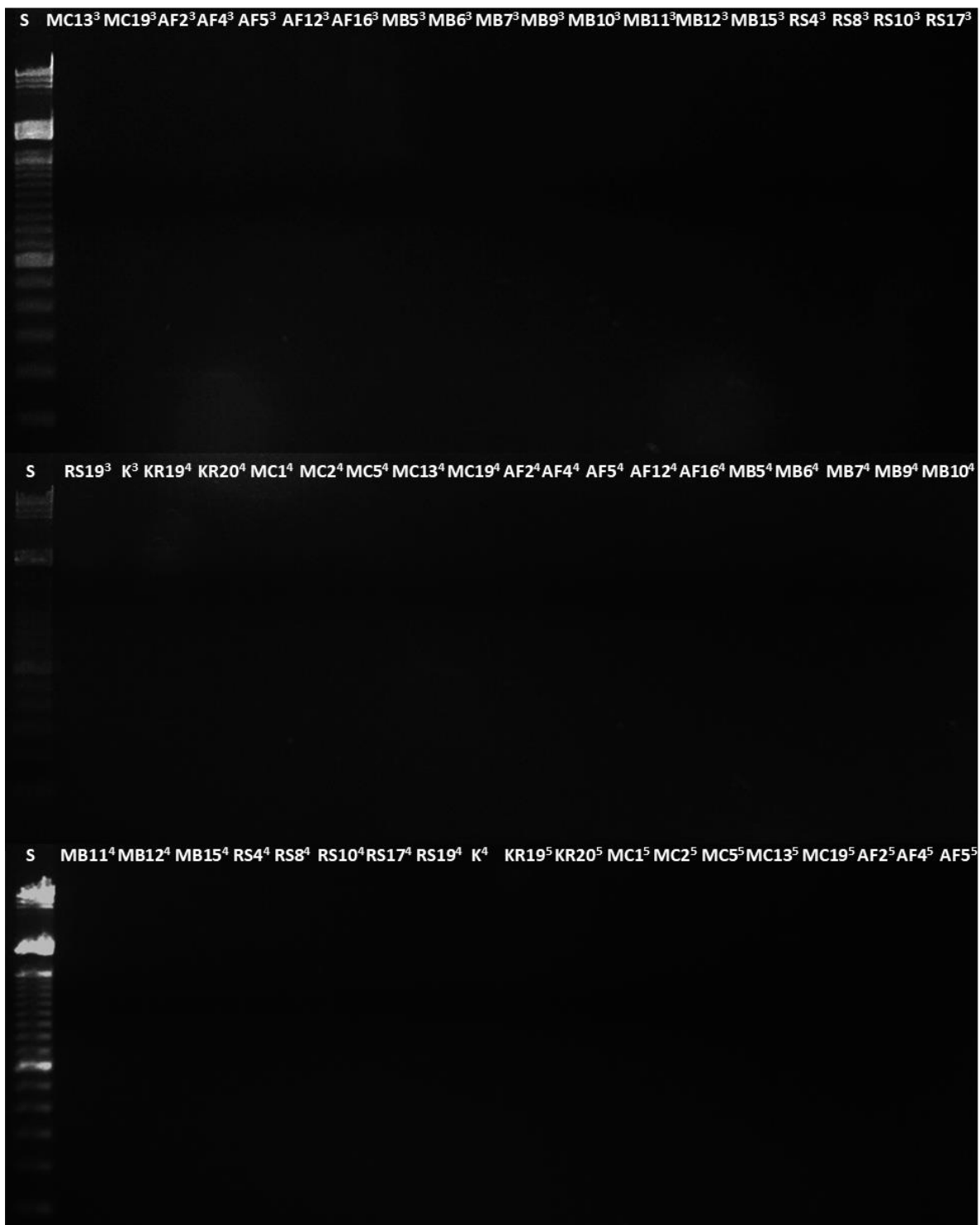
Slika 4. DNA elektroforeza produkata PCR (amplikona) reakcije sa specifičnim početnicama za gene odgovorne za rezistenciju na kanamicin (3), vankomicin (4) i tetraciklin (5)