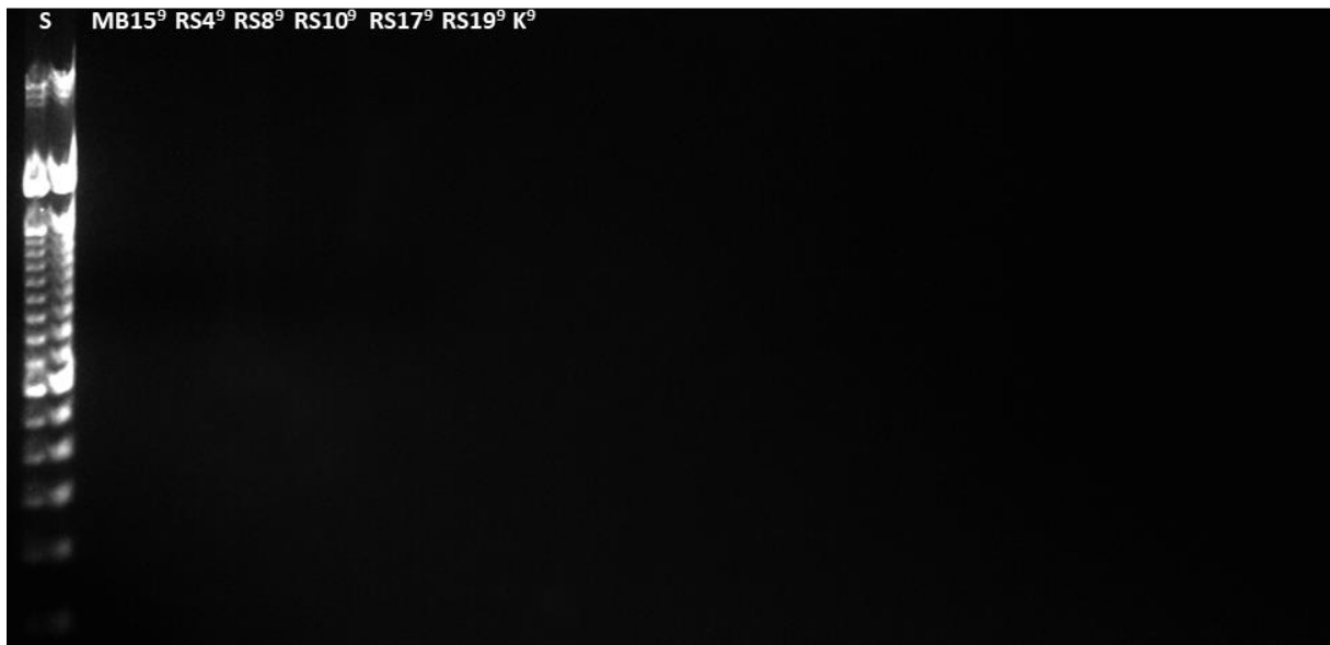
Slika 7. DNA elektroforeza produkata PCR reakcije sa specifičnim početnicama za gene rezistencije za gentamicin (9)