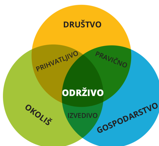
Slika 1. Tri sastavnice održivog razvoja (LORA, 2019)

Održivi razvoj je način proizvodnje i potrošnje koji vodi računa o prirodnim resursima ekosustava unutar kojeg se ti procesi događaju. Oslanja se na ideju prema kojoj razvoj ne smije ugrožavati budućnost nadolazećih naraštaja trošenjem neobnovljivih izvora i dugoročnim devastiranjem i zagađivanjem okoliša. Cilj održivog razvoja je trojak – teži gospodarskom razvoju, socijalnom napretku i zaštiti okoliša (slika 1) (ODRAZ, 2022).