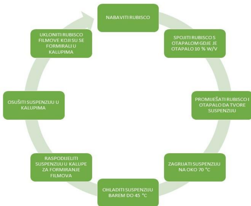
Slika 5. Primjer metode proizvodnje RuBisCO filmova ( prema Sebastian i sur., 2018)

Sebastian i sur. (2018) patentirali su način dobivanja filmova iz proteina RuBisCO-a. Slika 5 prikazuje postupak dobivanja RuBisCO filmova.