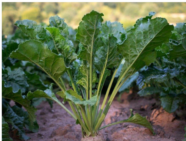
Slika 2. Lišće šećerne repe (Anonymous 2)