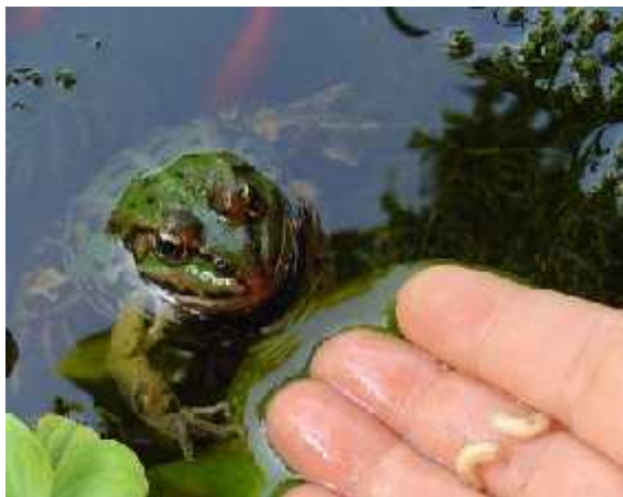
Sl. 1. Vodozemci su važni predatori malih beskralješnjaka

Vodozemcima su primarna hrana kukci i ostali beskralješnjaci, uključujući i one koji su prenosnici ljudskih bolesti (npr. komarci - prijenosnici malarije). Postoje procjene da je samo jedna populacija od 1000 žaba sposobna pojesti čak 5 milijuna beskralješnjaka u periodu od jedne godine. Očito je da su vodozemci jako važni predatori malih beskralješnjaka (Sl. 1.), ali isto su tako i izdašni izvor hrane za veće kralješnjake. Oni su važna poveznica tih dvaju nivoa u hranidbenom lancu. Njihovim nestajanjem dolazi do domino efekta i urušavanja ekosustava što može imati drastične posljedice i za uvijek (Bishop, 2006.).