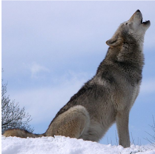
Slika 10. Zavijanje en.wikipedia.org

što onemogućava slušatelju da odredi točan broj članova čopora (Mech, Boitani, 2003). Takvo prikriivanje pravog broja može loše izaći za suparnički čopor ako su krivo procijenili broj. Zavijanje se čuje na udaljenosti od 16 km pri povoljnim vremenskim uvjetima (en.wikipedia.org).