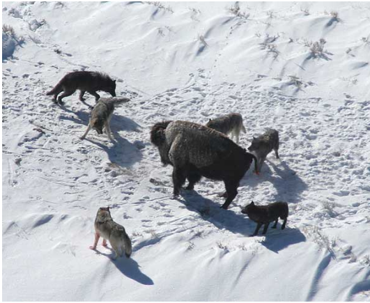
Slika 12. Bizon stoji i povećava si šanse za preživljavanje

Vukovi su primarno noćne životinje i izbjegavaju dnevnu vrućinu. Obično počinju loviti u sumrak. Plijen pronadu pomoću njuha i sluha te slučajnog susreta. Oslabljene životinje mogu pokazati svoje stanje položajem tijela, nekoordiniranim pokretima, mirisom rana ili infekcija te nekim drugim određenim signalom. Neposredno prije potjere vukovi prilaze žrtvi niz vjetar da ih ne bi odao miris upozoravajući plijen. Ako plijen počne trčati (sl.13), vukovi ga progone (www.wolfcountry.net).