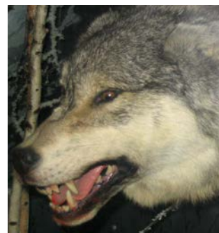
Slika 3. Očnjaci vuka

Vuk se hrani gotovo isključivo mesom, kostima i drugim dijelovima tijela životinja koje lovi, pa mu je i glava građena tako da omogućava hvatanje i jedenje plijena. Glava vuka je izdužena prema naprijed, duga prosječno 25, a široka 14 cm. Volumen mozga je od 150 do 170 cm 3 , što je najmanje 30 cm 3 više nego u većine pasa. Masivne čeljusti daju osnovu za koju su pričvršćeni snažni žvačni mišići i 42 specijalizirana zuba. Očnjaci (sl. 3) su najveći, a služe za hvatanje i ubijanje plijena. Za žvakanje i "rezanje" mesa i tetiva vuk se najviše koristi četvrtim gornjim pretkutnjakom i prvim donjim kutnjakom (karnasijalni zubi), koji pri žvakanju djeluju kao škare, dok mu za lomljenje kostiju služe snažni kutnjaci ( www.life-vuk.hr ). Sva osjetila, a naročito njih i sluh, u vuka su odlično razvijena ( www.life-vuk.hr ).