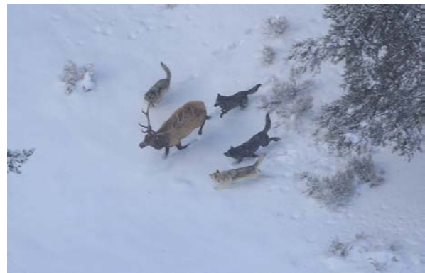
Slika 13. Los trči i smanjuje si šanse za preživljavanje

Ako plijen ostane stajati (sl.12), može otjerati vukove iako vukovi češće ostanu čekati. Većina čopora odmara dok jedan ili dva člana iskušavaju plijen i traže znakove zamora. Pri napadu se plijen hvata ili za njušku ili zadnjicu. Plijen iskrvari, umire od šoka ili oboje. Ako je plijen manji, može mu puknuti vrat od siline ugriza (www.wolfcountry.net). Alfa par jede prvi, a onda ostali sukladno hijerarhiji ako je plijen manji, ali ako je dovoljno velik svi se hrane u isto vrijeme (Mech, 1999). Plijenu prvo pojedju unutarnje organe ili zadnjicu ako je bila oštećena u lovu, mišići i meso su zadnji na redu. Budući da vukovi imaju jake čeljusti, mogu zdrobiti kosti da dođu do njihove meke unutrašnjosti. Vukovi ostavljaju jako malo svoga plijena nepojedeno (www.wolfcountry.net).