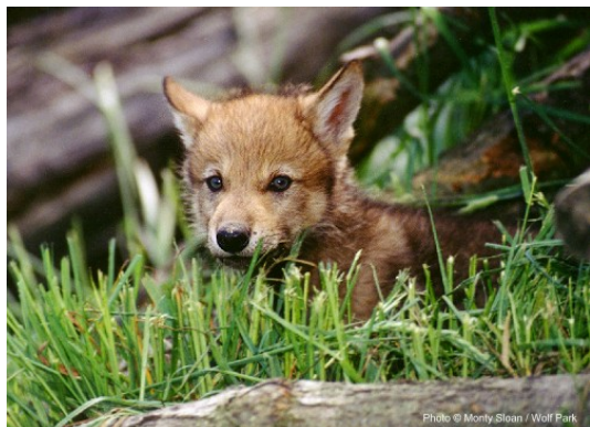
Slika 5. Štene

Kada alfa ženka uđe u estrus, ona i mužjak će provesti neko vrijeme odvojeni od ostatka čopora. Tjeranje traje 5 – 14 dana, za vrijeme kojeg dolazi do parenja ( www.animaldiversity.ummz.umich.edu ). Trudnoća traje 62, 63 dana, a vučići (sl. 5) se rađaju u brlogu koji je vučica prije iskopala (Feldhamer, Thompson, Chapman, 2003). Ako se brlog