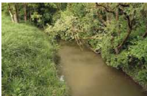
Slika 9. Rijeka Pakra- tipična nizinska rijeka kao stanište vidre

Tijekom 2004. godine u sjeverozapadnom dijelu ribnjaka vidjena su dva mladunca vidre što je dokaz da se one i razmnožavaju na samim ribnjacima. Zbog svojih stalnih i stabilnih izvora hrane te staništa odgovarajućim zaklonom, ribnjaci Poljana jedan su od najvažnijih lokaliteta za očuvanje i zaštitu vidre na području županije. Vidre koriste i ostale manje vodotoke za kretanje po području, osobito one koje posjeduju prirodnu obalu i odgovaraju u vegetaciju koje osigurava zaklon. Recentna istraživanja rasprostranjenosti vidre u Hrvatskoj pokazala su da se u slijevnom području Ilove i Pakre (Sl.9.) nalazi jedna od najgušćih populacija vidri koja je za Ilovu i pripadajuće šaranske ribnjake procijenjena na 33 jedinke, što čini 2,3 % nacionalne populacije. Iz tih razloga su rijeka Ilova i rijeka Toplica predložene za jedno od 31 važnog područja za vidre u Hrvatskoj (Mikuska i Livak, 2010.).