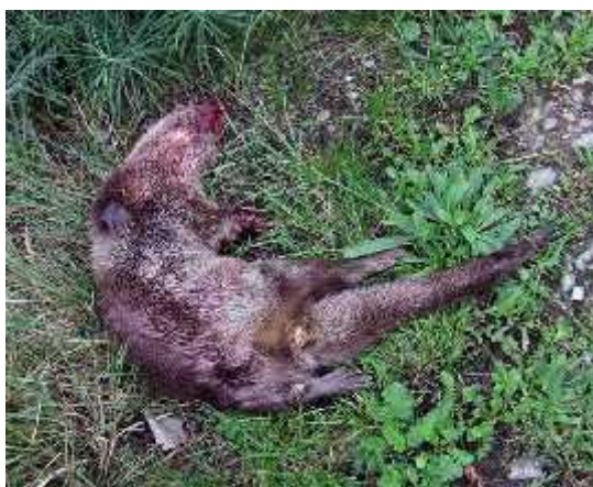
Slika 10. Vidra stradala na prometnici

Vidru ugrožava redovito iš enje “zelenih koridora” (kanala, potoka, obalnih zona) koji imaju važnu ulogu u migracijama vidre. Stradavanja u prometu (Sl.10.) su esta zbog nedostatka tunela i prolaza za životinje. Vidru najviše ugrožava one iš enje voda, time nestaju organizmi kojima se one hrane, a javlja se problem akumuliranja toksi nih tvari kroz hranidbeni lanac. Nedostatak financijske potpore ribnja arstvu uzrokuje napuštanje ribnjaka koji su bili pogodno stanište vidrama. Vidru ugožavanju i problemi na prirodnim staništima kao što su ljetne suše i nedostatak hrane (Lanszki i Kova i , 2007.).