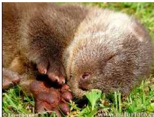
Slika 6. Mladun e vidre