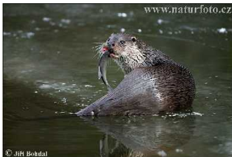
Slika 7. Vidra se hrani ribom

U prehrani vidre prevladavaju ribe (Sl.7.), a druge dvije skupine plijena koje imaju znatan udio u prehrani su rakovi i vodozemci. Normalno se hrani svakom vrstom ribe u razmjeru s njezinom brojnoš u te nema dokaza da izbjegava bilo koju vrstu. Rakovima se hrane u ljetnom razdoblju, a žabama obično u zimskom i proljetnom razdoblju. Vidra se povremeno lovi i druge kralješnjake (vodene ptice i glodavce) (Jelić, 2010.). U lov polazi sa zalaskom sunca i lovi do svitanja. Pri hvatanju ribe obično je podroni i uhvati za trbuh. Male ribe jede odmah u vodi, a veće od 30 dag iznosi na kopno i ondje ih jede, ostavljaju i glavu i peraje (Trohar, 1995.).