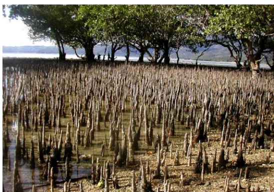
Slika 2. Zračno korijenje “pneumatofore”

( http://www.mangrove.at/images/mangrove/roots/coneroots/pneumatophores.jpg ).