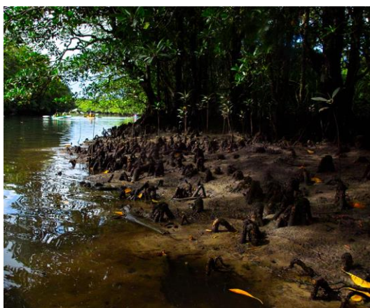
Slika 3. Bruguiera spp. koljenasto zračno korijenje

( http://www.mangrove.at/images/mangrove/roots/coneroots/pneumatophores.jpg ).