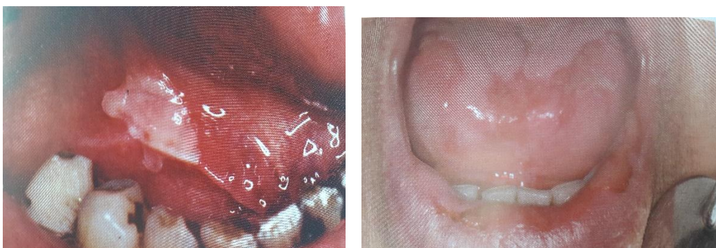
Slika 5 i 6. Pemphigus vulgaris i erythema exudativum multiforme. Preuzeto: (17).

Prije primjene kortikosteroida potrebno je isključiti infekcije uzrokovane mikroorganizmima, napose virusima (herpesa) kod kojih je primjena kortikosteroida kontraindicirana. Primjenjuju se lokalno, a u težim slučajevima i sistemno. Treba voditi računa da je kod pacijenata pod terapijom kortikosteroidima smanjena otpornost na infekciju i usporeno je cijeljenje rana te je potrebno provoditi asepsu. Ovi lijekovi se ne bi trebali primjenjivati kod hipersenzibilnog cervikalnog dentina ili pulpotomija zbog moguće infekcije bakterijama ili bi pacijente trebalo zaštititi antibioticima.