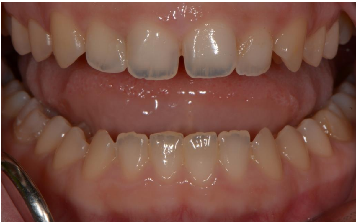
Slika 6. Intraoralni status pri prvom pregledu. Vidljiva abnormalna prozirnost incizalnih bridova gornjih i donjih sjekutića. Preuzeto s dopuštenjem autora: izv. prof. dr. sc. Jelena Dumančić.

Tijekom prvog posjeta učinjeno je supragingivno odstranjivanje tvrdih i mekih zubnih naslaga ultrazvučnim nastavkom te profilaktička fluoridacija gelom, a pacijentica je poslana da učini ortopantomogram kako bi se dobio uvid u stanje cjelokupne denticije.