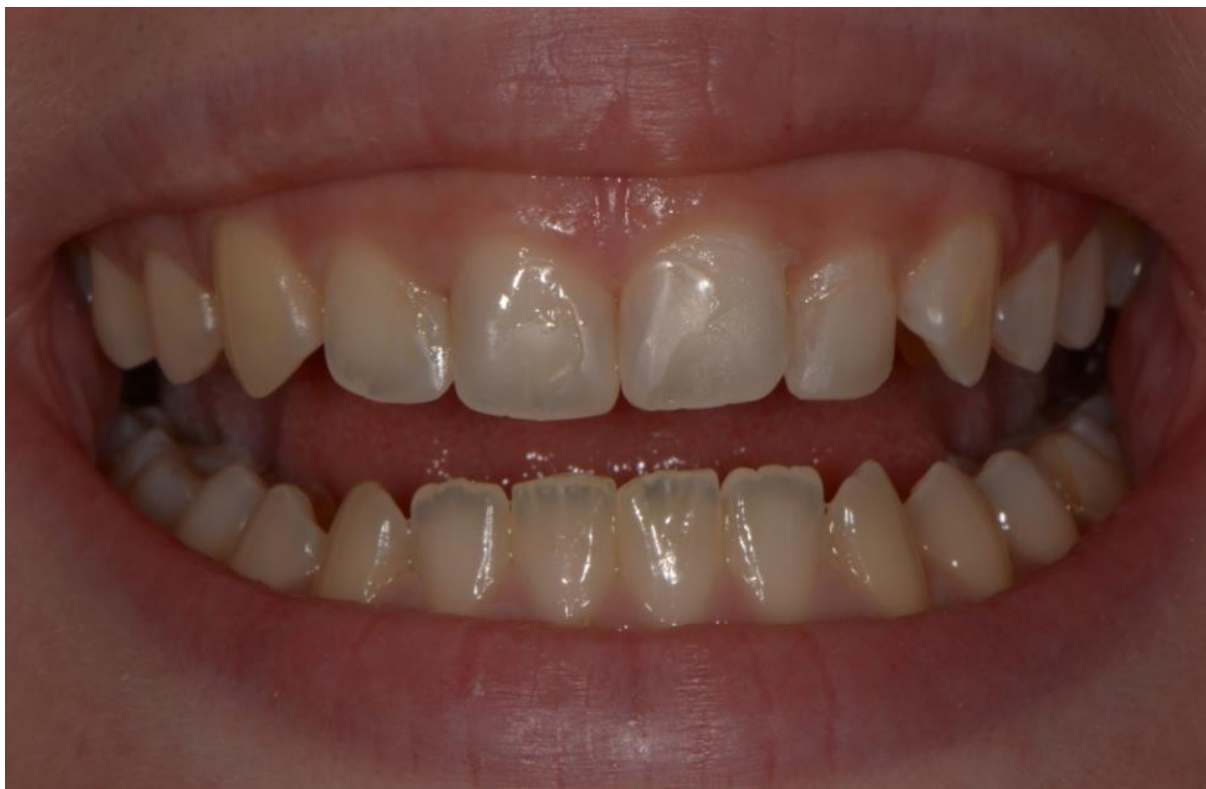
Slika 8. Izgled zuba pacijentice nakon terapije. Vidljiva je razlika u prozirnosti i boji opskrbljenih gornjih zuba naspram netretiranim donjim prednjim zubima.