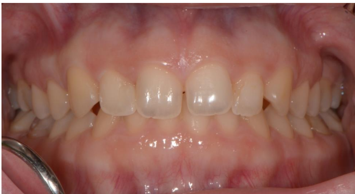
Slika 5. Intraoralni status pacijentice pri prvom pregledu, zubni lukovi u okluziji.

Pacijentica dolazi u ambulantu Zavoda za obiteljsku stomatologiju Klinike za stomatologiju Kliničkog bolničkog centra Zagreb u dobi od 21 godine. U anamnezi navodi anoreksiju od 12. godine, koja se 5 godina kasnije, u 3. razredu srednje škole intenzivirala bulimijom. Nakon psihološke terapije primarna je bolest izliječena. Pacijentica kao razlog dolaska navodi estetske nedostatke: sivilo zubi te dijastemu medijanu. Navodi da su se gornji frontalni zubi istanjili uslijed povraćanja, što je primijetila u posljednje tri godine. Slike 5. i 6. prikazuju intraoralni status na prvom pregledu.