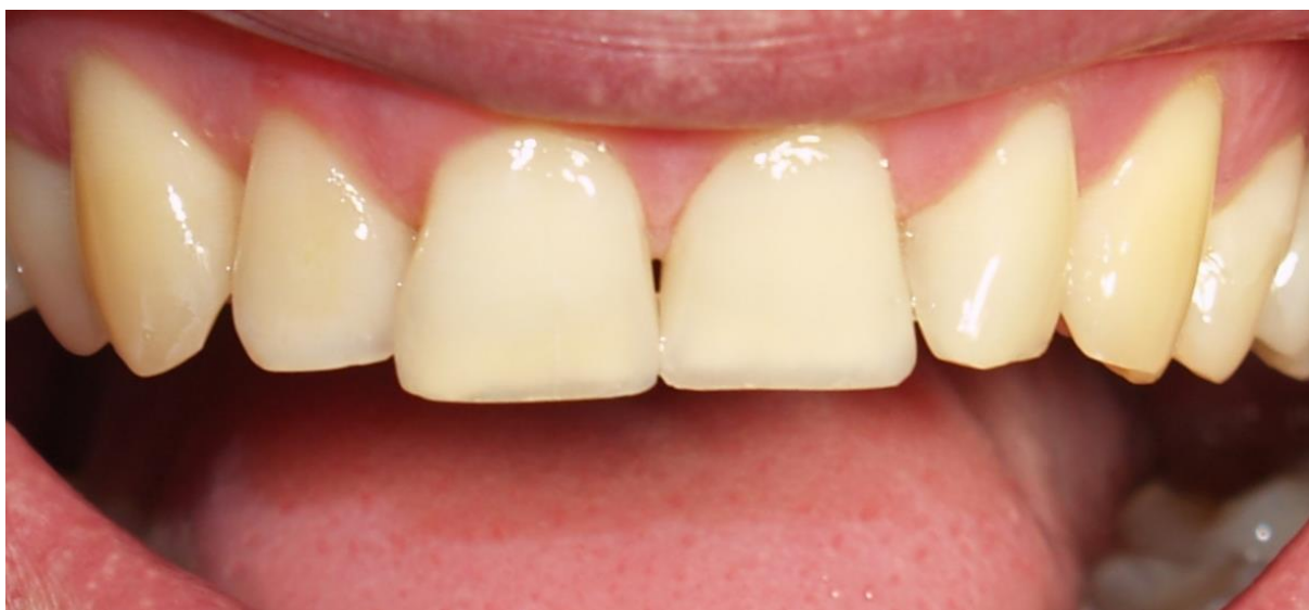
Slika 4. Izgled erodiranih zuba nakon terapije kompozitnim ispunima. Preuzeto s dopuštenjem autora: mr. sc. Ivan Bedek, dr. med. dent.

Direktnim metodama izrade restauracija (Slika 4.) daje se prednost nad indirektnima, pogotovo ako se radi o lokaliziranim labijalnim ili palatinalnim površinskim defektima.