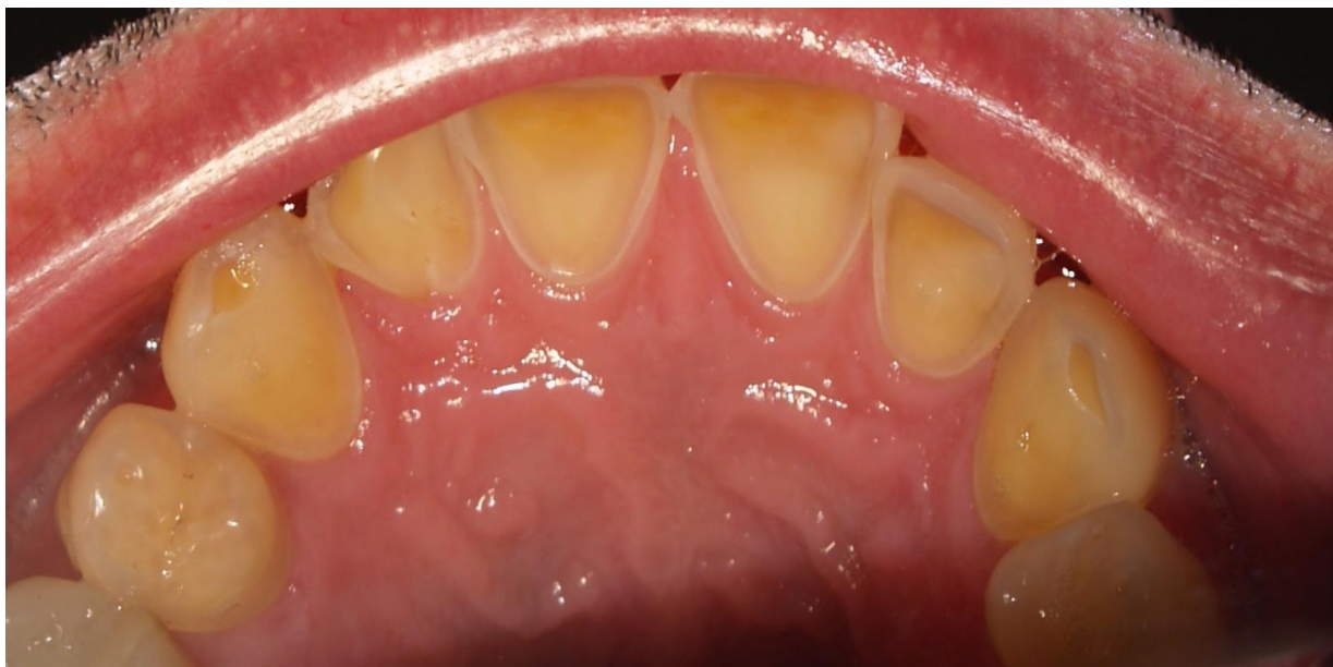
Slika 2. Izgled erozije na palatinalnim ploham gornjih sjekutića i očnjaka, vidljivo caklinsko-dentinsko spojište. Preuzeto s dopuštenjem autora: mr. sc. Ivan Bedek, dr. med. dent.

Gingivni rub cakline ostaje očuvan zbog difuzijske barijere plaka na tom dijelu zuba koji kiseline onemogućava prodor u caklinu te zbog neutralizacijskog djelovanja sulkusne tekućine čiji je pH između 7,5 i 8 (1, 28). Kvržice se snižavaju i postojeći ispuni izgledaju izdignuto nad preostalom zubnom strukturom. Slijed procesa dovodi do snižavanja vertikalne dimenzije okluzije (2).