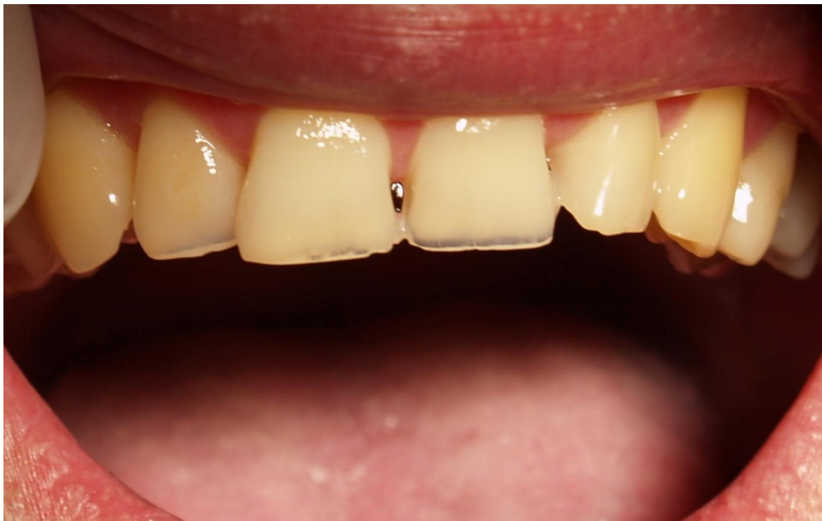
Slika 1. Izgled erozije, s vidljivim trošenjem incizalnih bridova. Dob pacijenta: 40 godina.

trošenje incizalnih bridova (engl. chipping ) (Slika 1.), a na stražnjim zubima dolazi do ulegnuća i snižavanja kvržica (engl. cupping ) (2, 10).