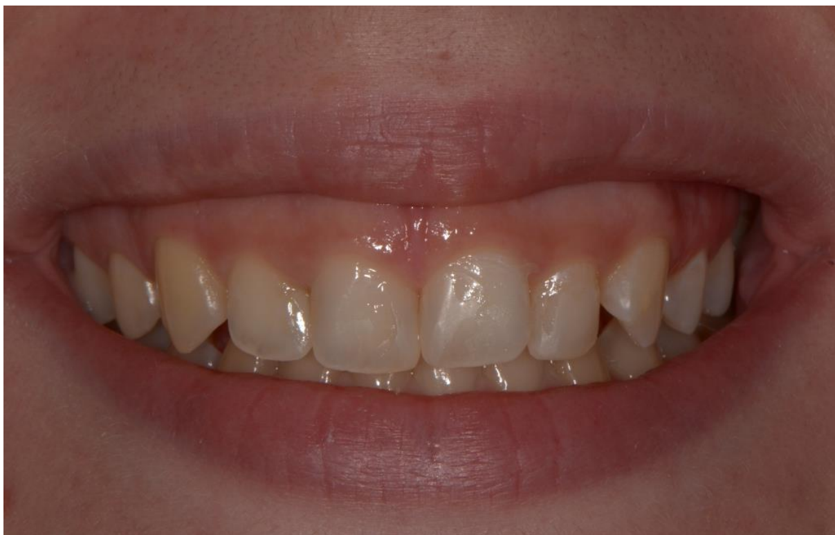
Slika 7. Izgled zuba pacijentice nakon zatvaranja dijasteme medijane i palatinalne nadogradnje incizalnih bridova kojom se kompenzirala erozija zubnih tkiva.

Učinjenim restauracijama zaustavljeno je daljnje trošenje zubnog tkiva na erodiranim plohama i postignut je estetski učinak na zadovoljstvo pacijentice.