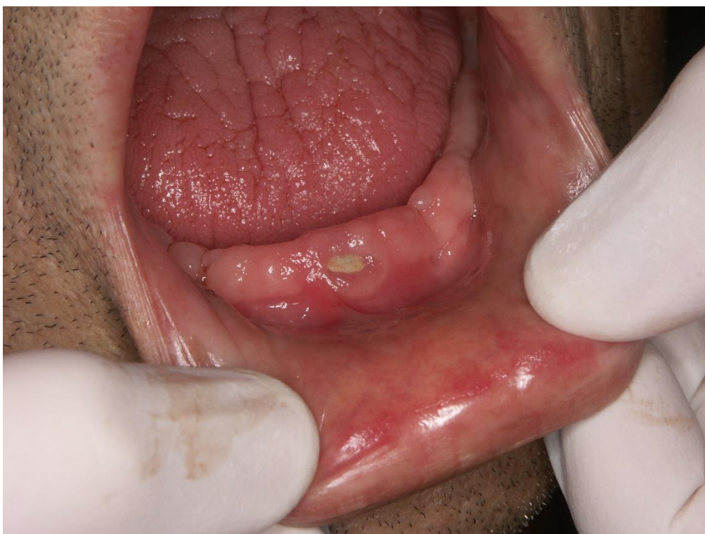
Slika 3. Stadij 1. MRONJ.

Stadij 1. karakterizira pojava eksponirane, nekrotične kosti ili fistule iz kosti, ali bez simptoma te bez znakova infekcije.