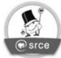
Slika 7.3. Primjer digitalne značke koju izdaje Centar za e-učenje Sveučilišnoga računskog centra nakon zadovoljavanja uvjeta za završetak tečaja

canje. U kontekstu otvorenog obrazovanja digitalne značke ( https://openbadges.org/ ) velik su potencijal da kvalitetni otvoreni obrazovni sadržaji budu prepoznati i da ih prihvate obrazovne ustanove, stručna društva ili tvrtke kao priznavanje znanja i vještina stečenih s pomoću otvorenih obrazovnih sadržaja.