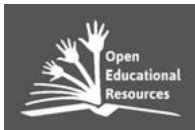
Slika 7.1. UNESCO-ov logotip otvorenih obrazovnih sadržaja

UNESCO-ov logotip otvorenih obrazovnih sadržaja (sl. 7.1) izrađen je kako bi se stvorio globalni vizualni identitet (Mello, 2012).