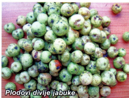
Plodovi divlje jabuke

Iz 100 kg plodova dobije se od 0,8 - 0,9 kg sjemena, dok 1 kg čistog sjemena sadrži od 10 000 do 45 000 ili u prosjeku 34 000. Prividni plod je kuglast ili jajast, prosječno promjera 2-2,5 (-4 cm), žutozelen, na sunčanoj strani često crvenkast te kiseloga okusa. Plodovi divlje jabuke sakupljaju se odmah nakon sazrijevanja zbog šteta od životinja. Divlja jabuka naginje prema alternirajućoj rodnosti.