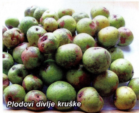
Plodovi divlje kruške

150 godina. Spada u skupinu ugroženih vrsta drveća i u budućnosti bi joj trebalo posvetiti što veću pozornost, kako u temama znanstvenih istraživanja, tako i u operativi kako ne bi nestala iz naših šuma.