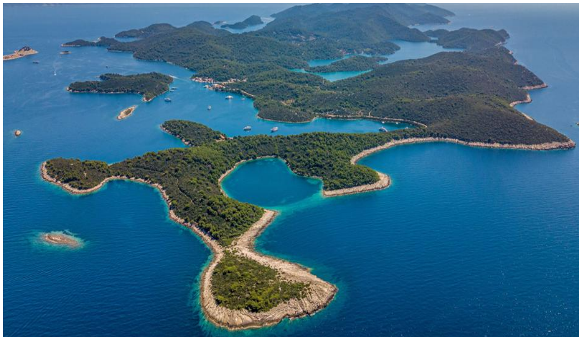
Slika 1. NP Mljet