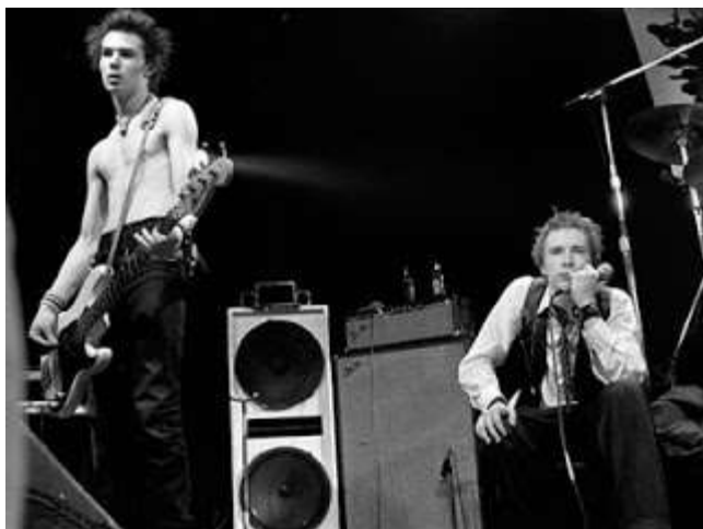
Slika 9.: Sex Pistols na zadnjem koncertu 1978.

Uz Pistole je istih godina vladao još jedan britanski punk bend, The Clash, koji su najpoznatiji po svojem trećem albumu „ London Calling “. Također su održavali punkerski stil. Sex Pistols se raspadaju 1978. godine odlaskom Johnny Rottena nakon što je posljednji koncert završio pjesmom “ No Fun ” vjerojatno sugerirajući na cijeli taj punk način života.