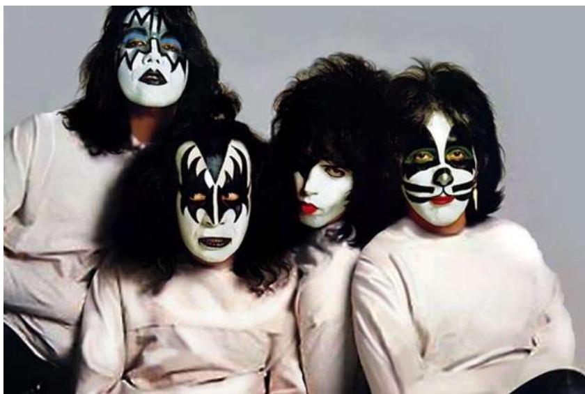
Slika 6.: Kiss 1979.

Slično Alicu Cooperu šminkali su se i članovi benda Kiss osnovanog 1973. iako, za razliku od Alice Coopera nisu svirali heavy metal već glam rock. Članovi ovog benda za vrijeme vrhunca svoje karijere nisu se u javnosti pojavljivali bez obojenih lica tako da je tada malo tko znao kako oni zapravo izgledaju. Za grupu Kiss bilo je specifično to što je svaki član uvijek imao našminkano lice na jednak način.