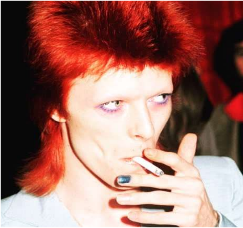
Slika 4.: David Bowie 1973.

Upravo zbog pojave različitih stilova i naglih promjena trendova, krajem šezdesetih odjeća se počinje masovno proizvoditi, a otvara se i sve više specijaliziranih butika. No baš zbog svoje dostupnosti, odjeća gubi na kvaliteti jer se više ne proizvodi da bi dugo trajala već se kolekcije mijenjaju po sezoni. (G. Lehnert., 2000., )