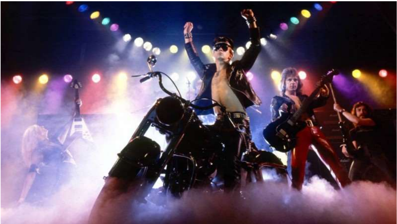
Slika 5.: Koncert Judas Priesta 1979.

Heavy metal postaje najkontroverznijim smjerom te ga se i danas takvim smatra. Tekstovi pjesama zvuče kao horror priče, a mladi naraštaji u želji za što strašnijim izgledom počinju nositi tamnu šminku, leće u bojama pa čak i vampirske zube.