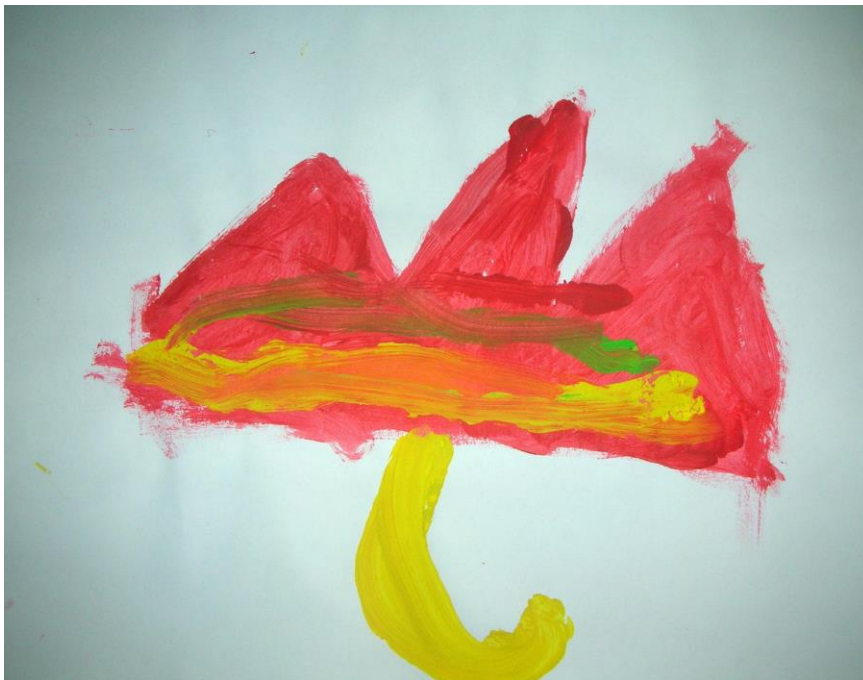
Slika 13. Mia, 6 godina