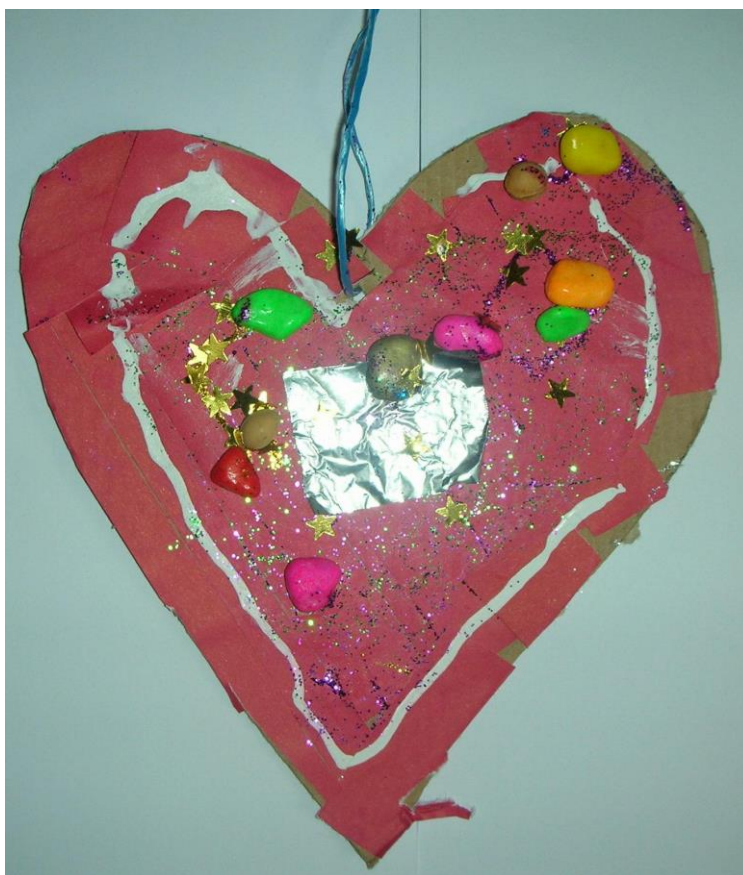
Slika 24. Anja, 6 godina