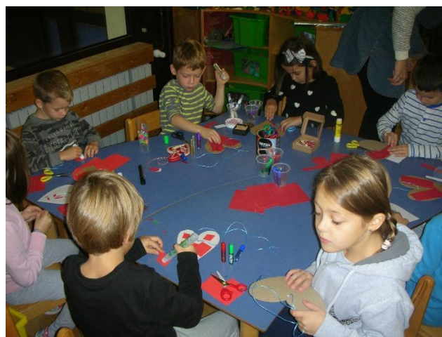
Slika 23. Stvaralački rad: ukrašavanje vlastitih licitara

Glavna aktivnost bila je da djeca od kolaž papira i mnoštva drugih ukrasnih predmeta koje sam donijela, naprave vlastito licitarsko srce. Djeci se izrada vlastitih licitara jako svidjela i važno je napomenuti kako se u aktivnost uključio dječak koji je inače vrlo nemotiviran za rad. Djeca su prvo proizvoljno (rukama ili škarama) trgala ili izrezivala crveni kolaž koji je bio baza na kartonski oblikovanom srcu. Ostalim materijalima (ljepilom, ljepilom u boji, korektorom, perlicama, kamenčićima i drugim ukrasima) stvarali su vlastiti licitar. Za vrijeme aktivnosti djeci sam ispričala običaj darivanja licitarskog srca mladića djevojci. Neki su tražili pomoć oko obrubljivanja srca bijelim korektorom, a umjesto stakalca zalijepili su komadić aluminijske folije koji im je bio ponuđen.