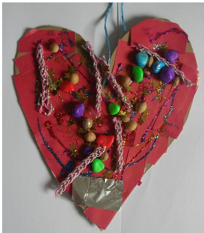
Slika 26. Marko, 6 godina