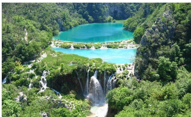
Slika 7. Nacionalni park Plitvička jezera (1979.)

Nepokretna kulturna baština je sa svojim kulturno – povijesnim značenjem sastavni dio čovjekove okoline. Zaštita i njezino očuvanje ne samo da je zaštićeno zakonskim odredbama, nego bi to trebalo biti dio čovjekove vlastite svijesti i odgovornosti kao individue.