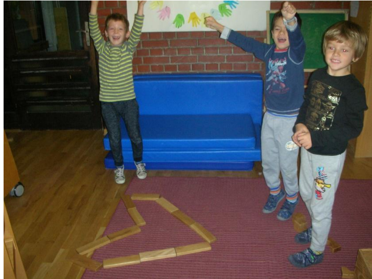
Slika 22. Novonastale aktivnosti iz poticaja

Glavna aktivnost bila je da djeca od kolaž papira i mnoštva drugih ukrasnih predmeta koje sam donijela, naprave vlastito licitarsko srce. Djeci se izrada vlastitih licitara jako svidjela i važno je napomenuti kako se u aktivnost uključio dječak koji je inače vrlo nemotiviran za rad. Djeca su prvo proizvoljno (rukama ili škarama) trgala ili izrezivala crveni kolaž koji je bio baza na kartonski oblikovanom srcu. Ostalim materijalima (ljepilom, ljepilom u boji, korektorom, perlicama, kamenčićima i drugim ukrasima) stvarali su vlastiti licitar. Za vrijeme aktivnosti djeci sam ispričala običaj darivanja licitarskog srca mladića djevojci. Neki su tražili pomoć oko obrubljivanja srca bijelim korektorom, a umjesto stakalca zalijepili su komadić aluminijske folije koji im je bio ponuđen.