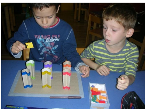
Slika 20. igranje poticajima

Nakon toga sam po centrima raspodijelila sve poticaje koje sam izradila zasebno za projekt. Na raspolaganju su imali slagarice s motivom licitara; srce i konj, zatim u obliku srca napravljeni zamotuljci od wc papira i mnoštvo boja koje je pincetom trebalo rasporediti u odgovarajuće kućice. I zadnji poticaj; slaganje životinja i drugih likova iz oblika srca. Dječaci su sagradili konstrukciju od kocaka u obliku srca, a druga su djeca na papiru crtala licitare.