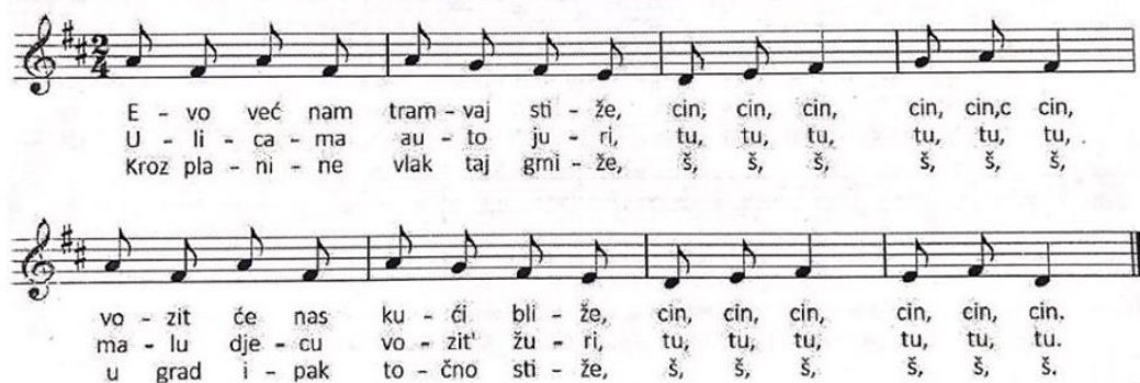
Slika 13: Pjesma "Tramvaj, auto, vlak" (Kraljić, 2017.)