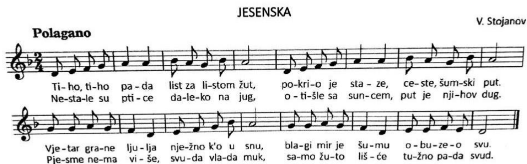
Slika 4: "Jesenska" pjesma (Kraljić, 2017.)