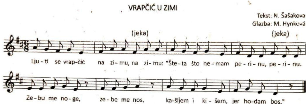
Slika 11: Pjesma "Vrapčić u zimi" (Kraljić, 2017.)