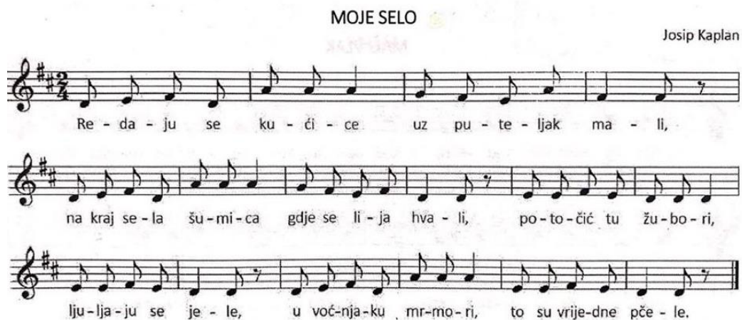
Slika 1: Pjesma "Moje selo" (Kraljić, 2017.)