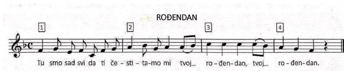
Slika 5: Pjesma "Rođendan" (Kraljić, 2017.)