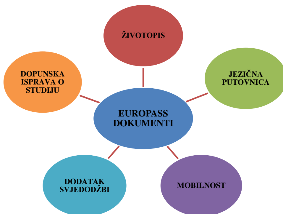
Slika 5: Europass dokumenti

U nastavku je pregledan shematski prikaz Europass dokumenata.