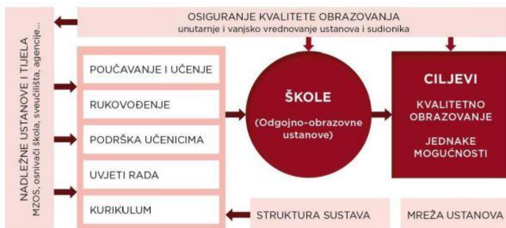
Slika 8: Osiguranje kvalitete obrazovanja http://narodne-novine.nn.hr/clanci/sluzbeni/2014_10_124_2364.html

Na slici je jasno vidljivo što je sve potrebno i tko sve sudjeluje u osiguranju kvalitete obrazovnog sustava.