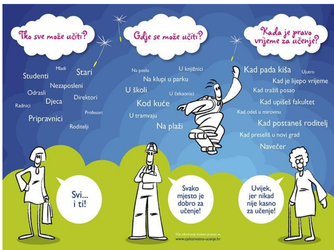
Slika 1: Tko, gdje i kada može učiti? ( http://os-jdobrile-rovinj.skole.hr/skola/knjiznica/kutak_za_ucitelje/cjeloivotno_ucenje )

Učenje nikad nije uzalud, a znanje, vještine i kompetencije nitko nikome ne može oduzeti.