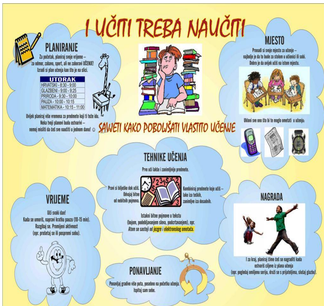
Slika 2: Kako učiti? ( http://www.pcdm.hr/adolescenti/organizacija-ucenja-219/ )

Da bi svako učenje bilo uspješnije treba naučiti kako učiti. Učenje mora biti efikasno i kvalitetno. Slika 2 na zanimljiv način prikazuje kako si svatko može olakšati učenje i učiniti ga efikasnijim.