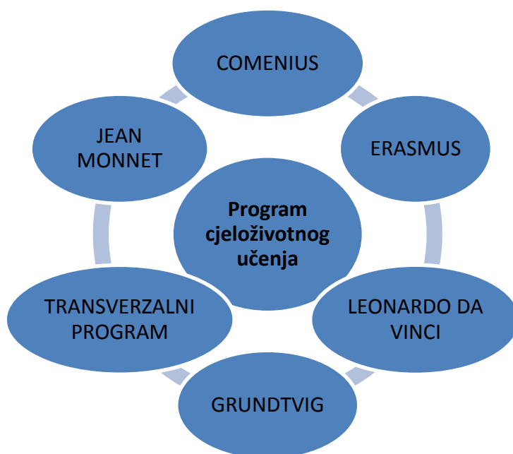
Slika 4: LLP-potprogrami

U nastavku je shematski prikaz prethodno objašnjenih potprograma Programa za cjeloživotno učenje. Važno je naglasiti da u Programu cjeloživotnog učenja mogu sudjelovati svi članovi na svim razinama obrazovnog sustava: učenici, učitelji, nastavnici, studenti, profesori, administrativno osoblje u vrtićima, školama, na fakultetima.