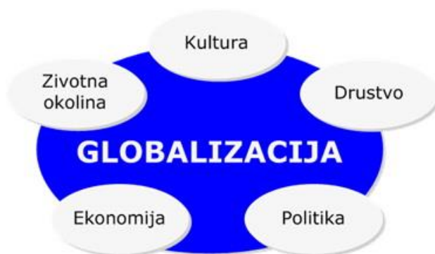
Slika 6: Globalizacija i promjene ( www.dadalos.org )

Kao što je već više puta spomenuto obrazovni sustav prolazi kroz promjene, a na njega značajan utjecaj ima globalizacija koja, osim što utječe na društvo općenito, itekako utječe na sadržaj obrazovanja i način poučavanja. Suvremeni učitelj treba se neprestano usavršavati u svom zanimanju, koristiti sve mogućnosti europskih obrazovnih politika i mogućnosti cjeloživotnog obrazovanja u kontekstu svih prethodno navedenih programa nadležnih agencija koje svi članovi Hrvatske (tako i učitelji) kao potpisnice programa i potprograma vezanih uz cjeloživotno učenje mogu koristiti. Shema prikazuje na koja područja života utječe globalizacija.