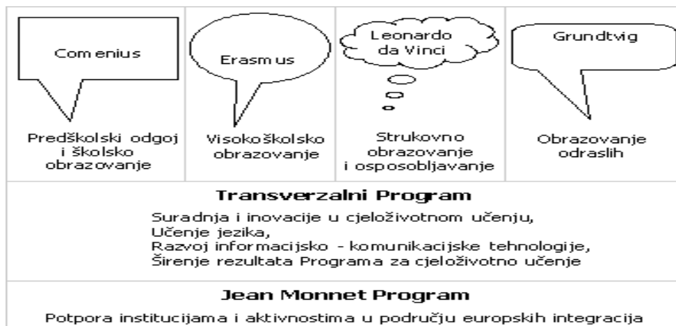
Slika 3: Program za cjeloživotno učenje-potprogrami prema područjima ( http://arhiva.mobilnost.hr/index.php?id=237 )

projekta ( www.unizg.hr ). Objavljeni natječaji mogu se vidjeti na web stranicama EACEA-e ili Agencije za mobilnost i programe EU.