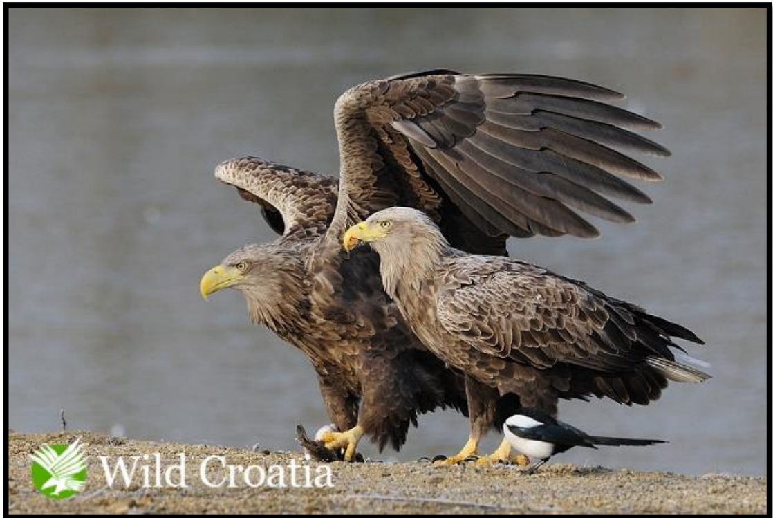
Slika 8. Skupljanje hrane za ptiće